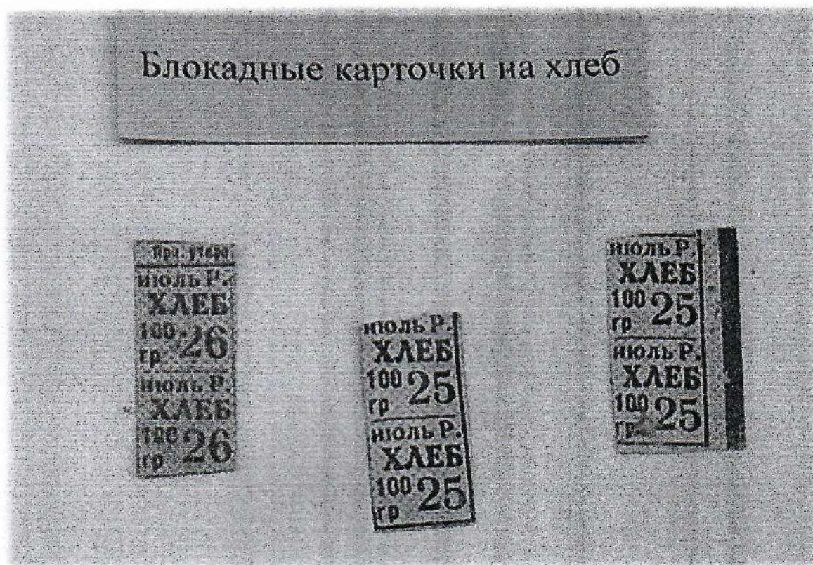
Рисунок 2 – Блокадные карточки на хлеб

В Музее блокады Ленинграда среди множества экспонатов едва ли не самый большой интерес у посетителей обычно вызывает небольшой продолговатый листок тонкой бумаги с отрезанными квадратиками. В каждом из квадратиков – несколько цифр и одно слово: «хлеб». Это блокадная хлебная карточка.