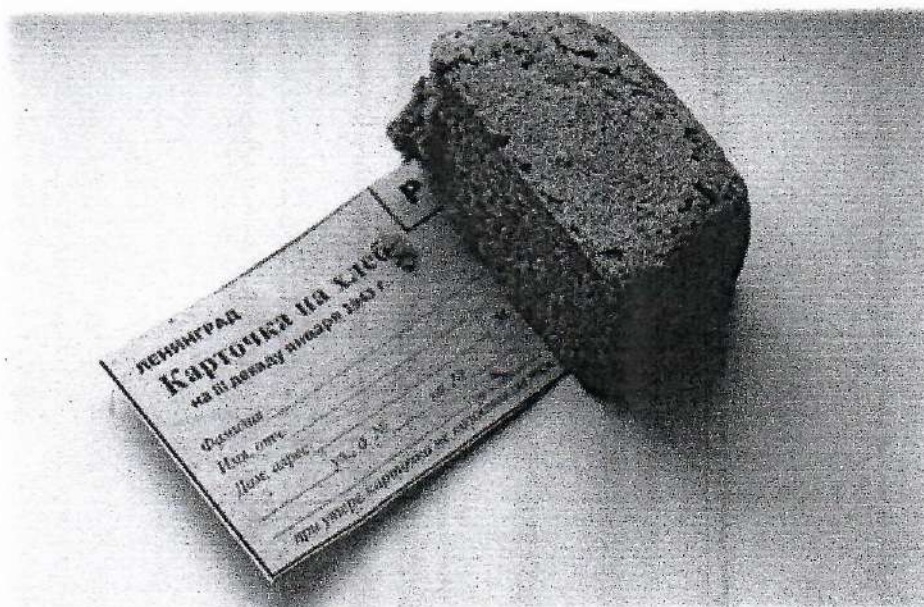
Рисунок 1 – Хлеб блокадного Ленинграда.

Блокадный хлеб... Муки в нем было ненамного больше, чем жмыха, целлюлозы, соды, отрубей. Форму для выпечки, которого смазывали за неимением другого соляровым маслом. Есть который можно было, как говорили сами блокадники, «только запивая водой и с молитвой». Но и сейчас нет для них ничего дороже него.