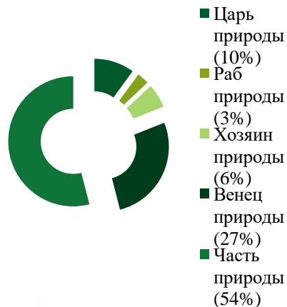
Диаграмма тестирования в 5 «а» классе