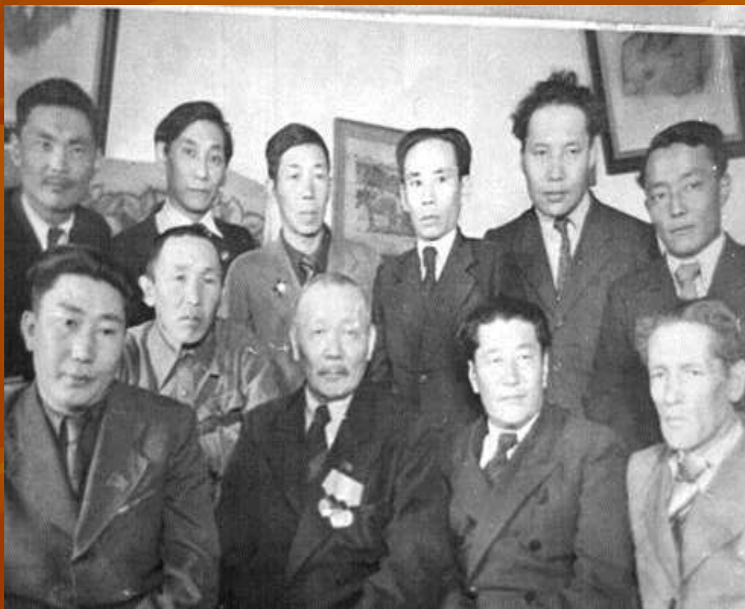
Н Хоца амсараев