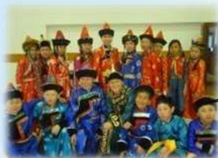
Фольклорная студия «Лаадуухай»