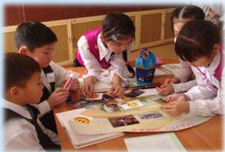
Копилка Добрых дел