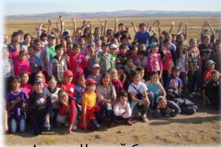
Акция «Чистый берег»