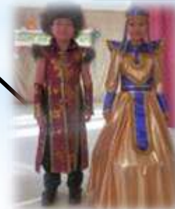
Театр этномоды «Алтаргана»