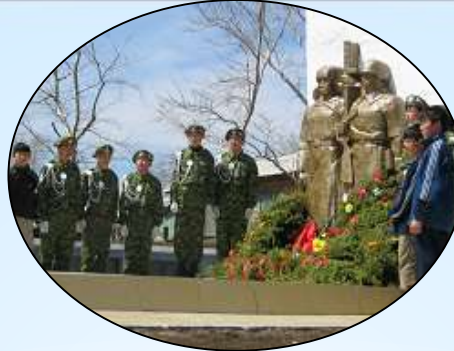
Клуб «Юный патриот»