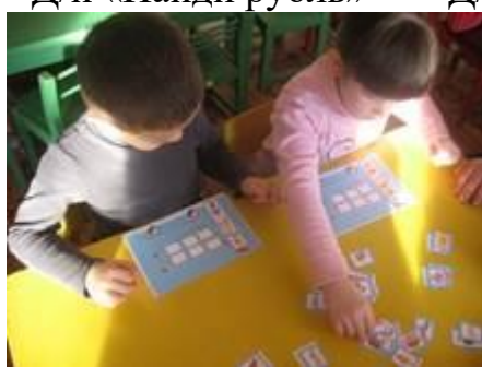
Д/и «Знаю все профессии»