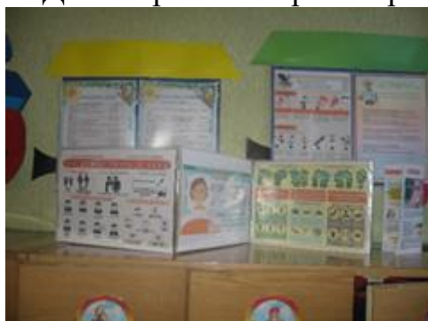
Уголок для родителей