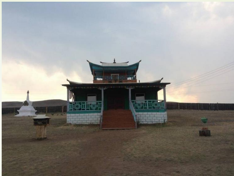
Буддийский дуган в Зурган-Дэбэ.