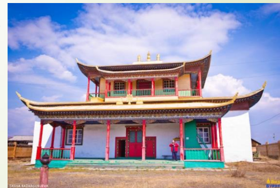
Дацан в с.Зурган-Дэбэ