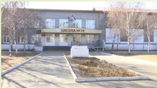
г.Улан-Удэ, школа №19