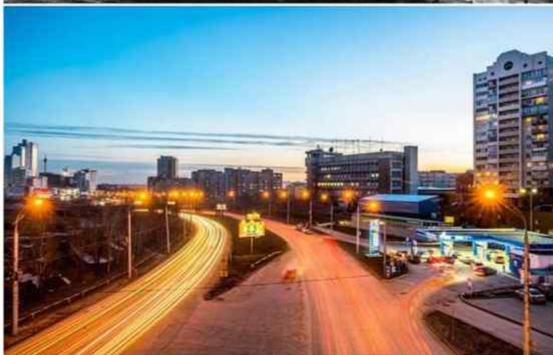
Вид на центральную часть города.