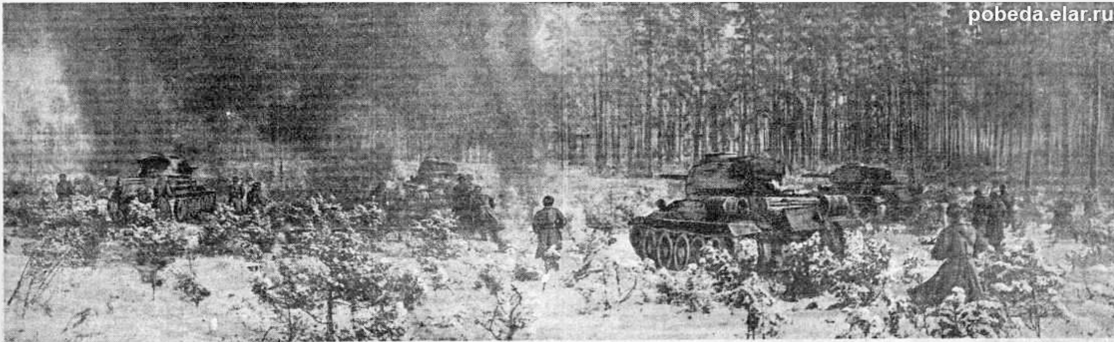
В ВОСТОЧНОЙ ПРУССИИ. Пехота при поддержке танков атакует узел сопротивления немцев.