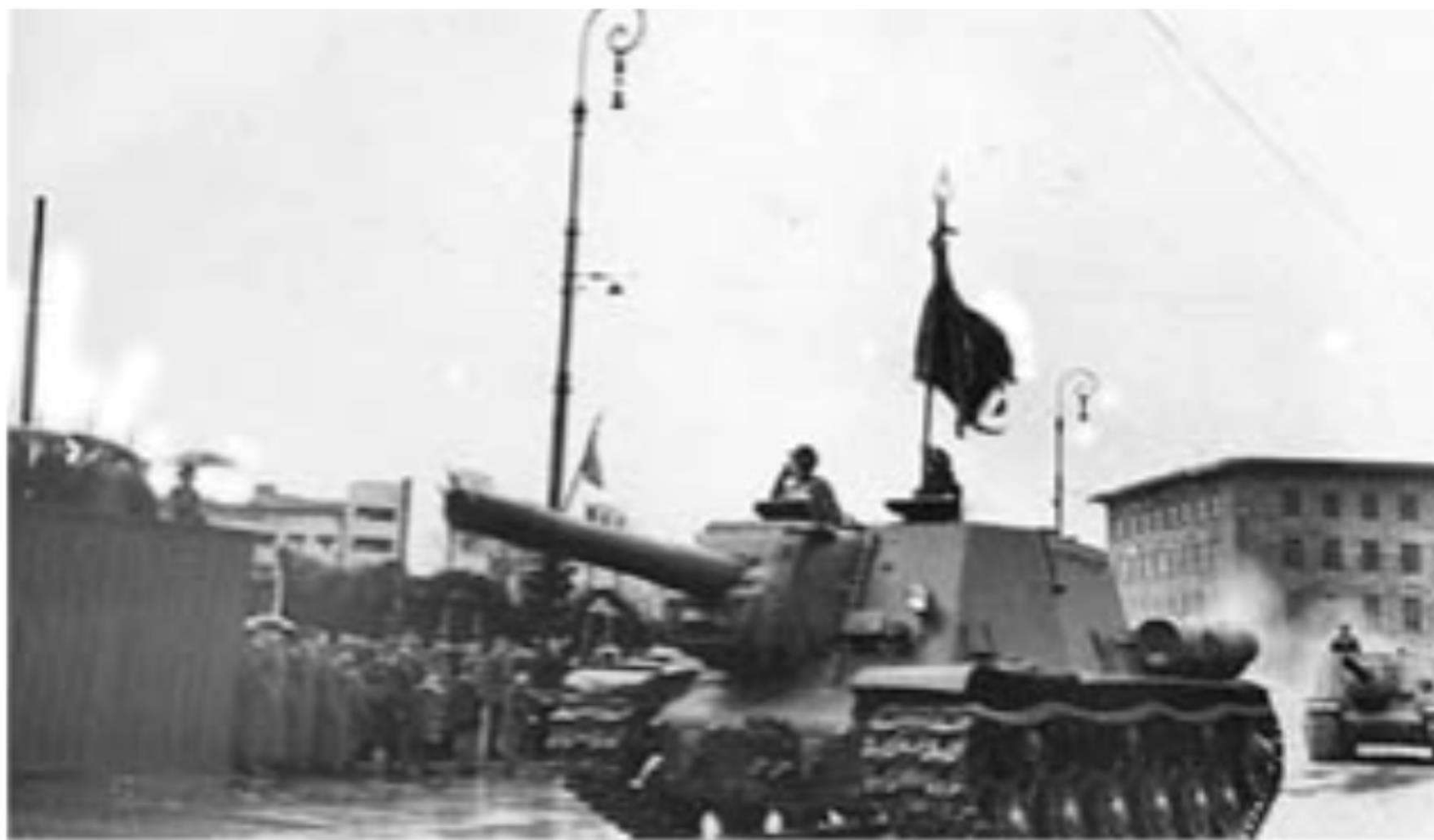
Калининград. Военный парад на площади Трёх Маршалов (ныне - площадь Победы). 1 мая 1947года