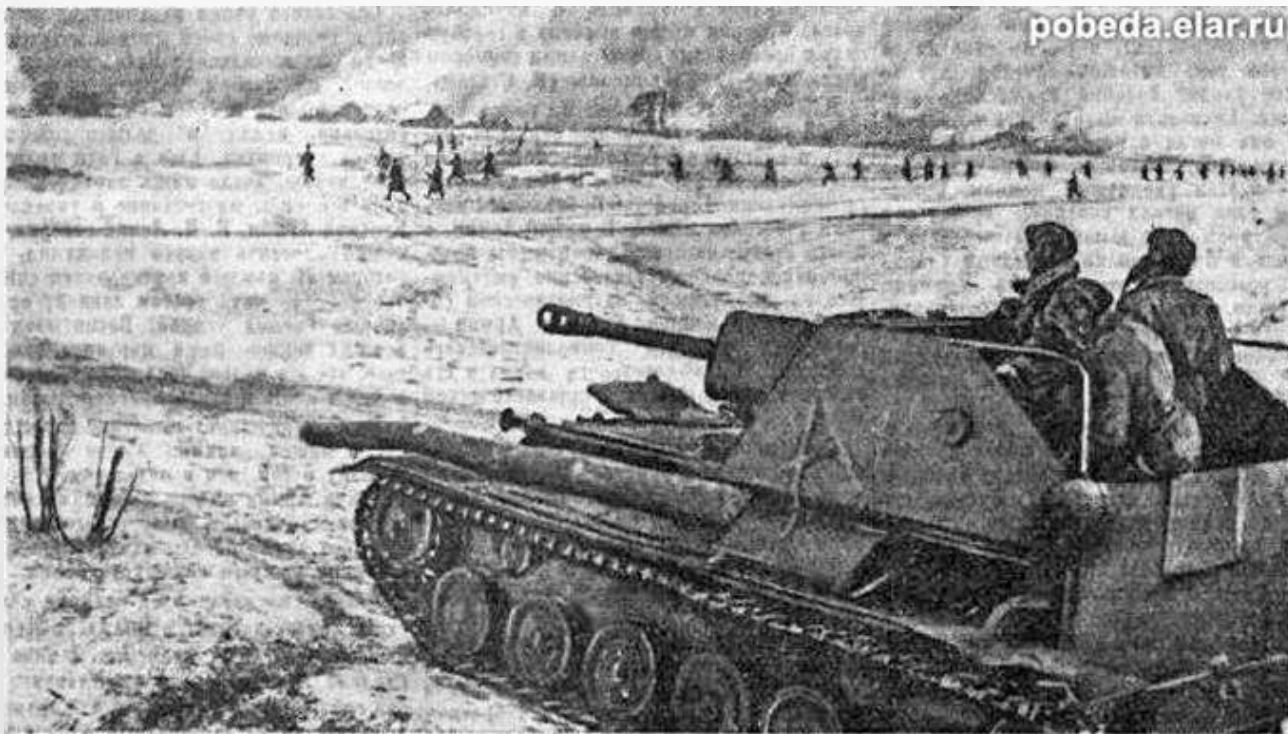
Восточная - Пруссия. Четыре Красной Армии в наступлении.