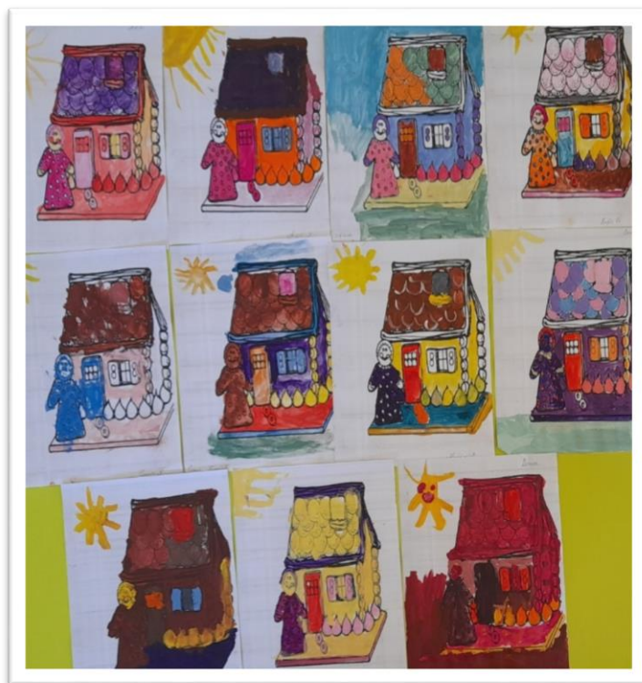
художественно-эстетическое развитие « Пряничный домик» (по сказке «Гензель и Гретель»)