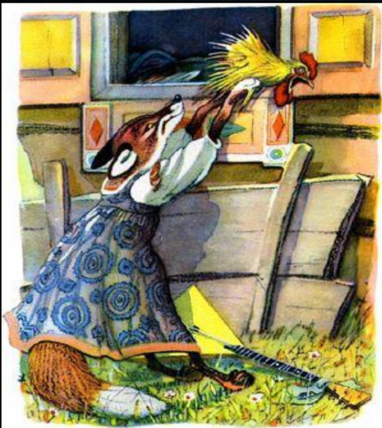
Петушок – золотой гребешок