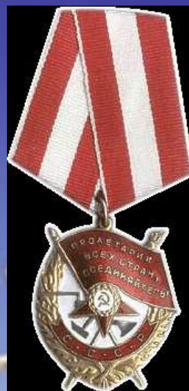
Орден Красного знамени