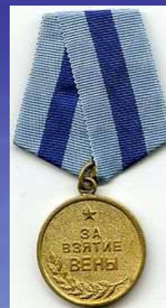
Медаль за взятие Вены