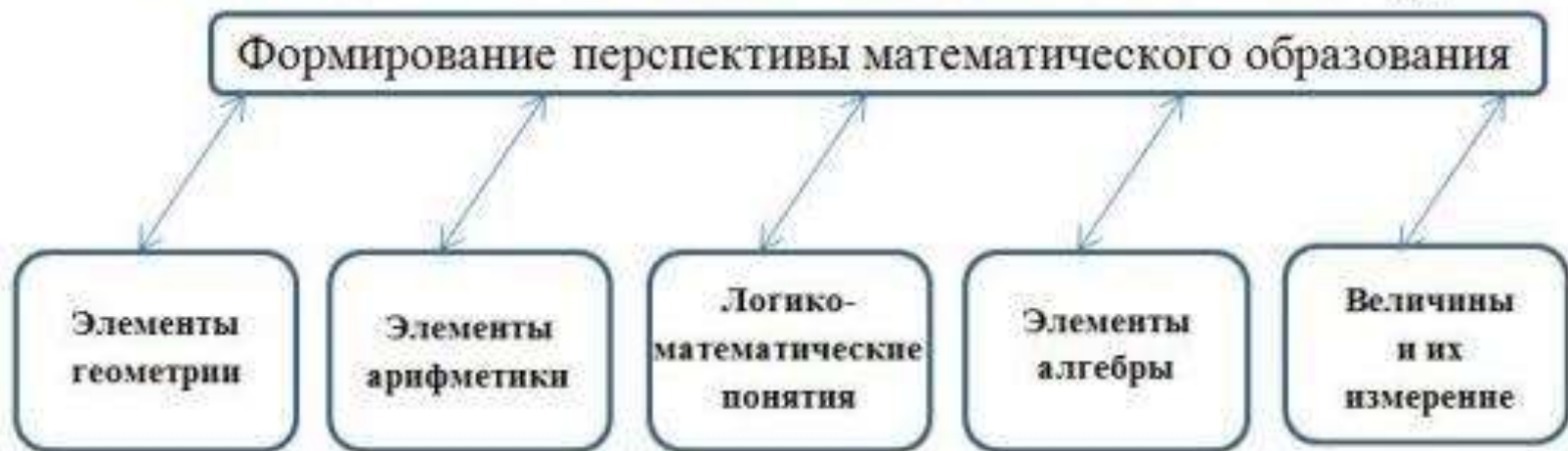
Схема 1. "Пять взаимосвязанных линий математического курса"

Учебное пособие содержит арифметические, алгебраические, геометрические и логические материалы. Такое разнообразие обусловлено тем, чтобы дать перспективу математического образования учащихся. Пять линий математического курса, влияющих на развитие, можно представить в виде схемы.