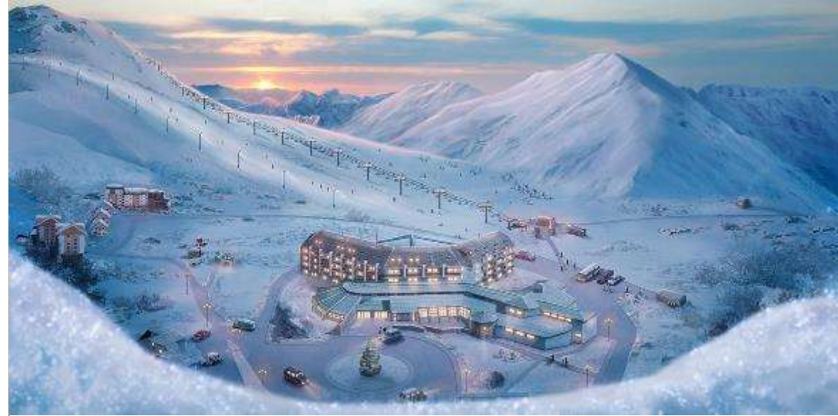
Гудаури в Грузии

В России тоже есть превосходные курорты, где вам понравится – это Шерегеш на Алтае и Домбай на Кавказе. Радует и Краснодарский край – Сочи уже не первый год притягивает внимание активных и взыскательных туристов.