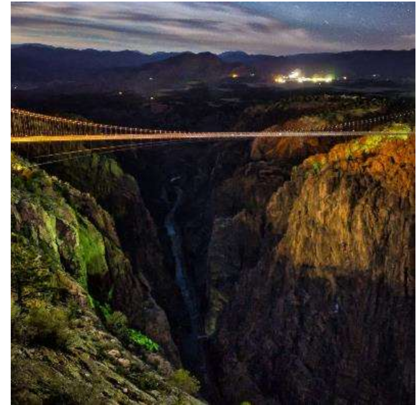
Мост Royal Gorge Bridge в США

К слову, самый высокий прыжок роупджампинг был совершен в Китае, где спортсмен спрыгнул с башни Макао высотой 233 метра – это событие было включено в Книгу рекордов Гиннеса. Кто знает, быть может, вы так увлечетесь, что сможете покорить еще большие высоты, а хобби превратится в профессиональное занятие?