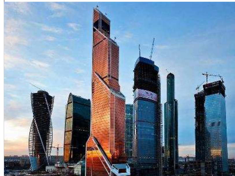
Небоскреб Меркурий в Москва-Сити