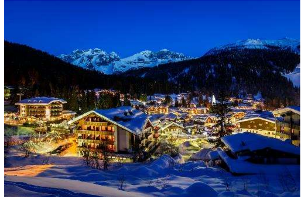
Мадонна ди Кампильо в Италии