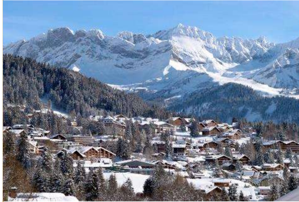
Швейцария – Виллар