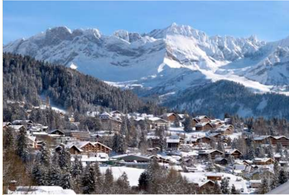
Швейцария – Виллар