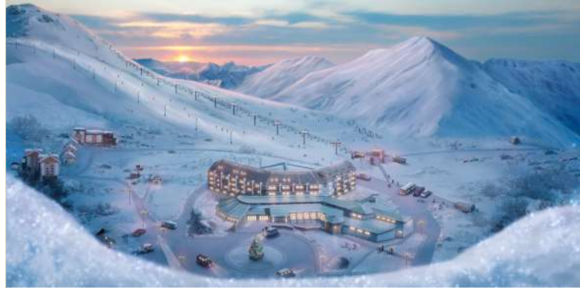
Гудаури в Грузии

В России тоже есть превосходные курорты, где вам понравится – это Шерегеш на Алтае и Домбай на Кавказе. Радует и Краснодарский край – Сочи уже не первый год притягивает внимание активных и взыскательных туристов.