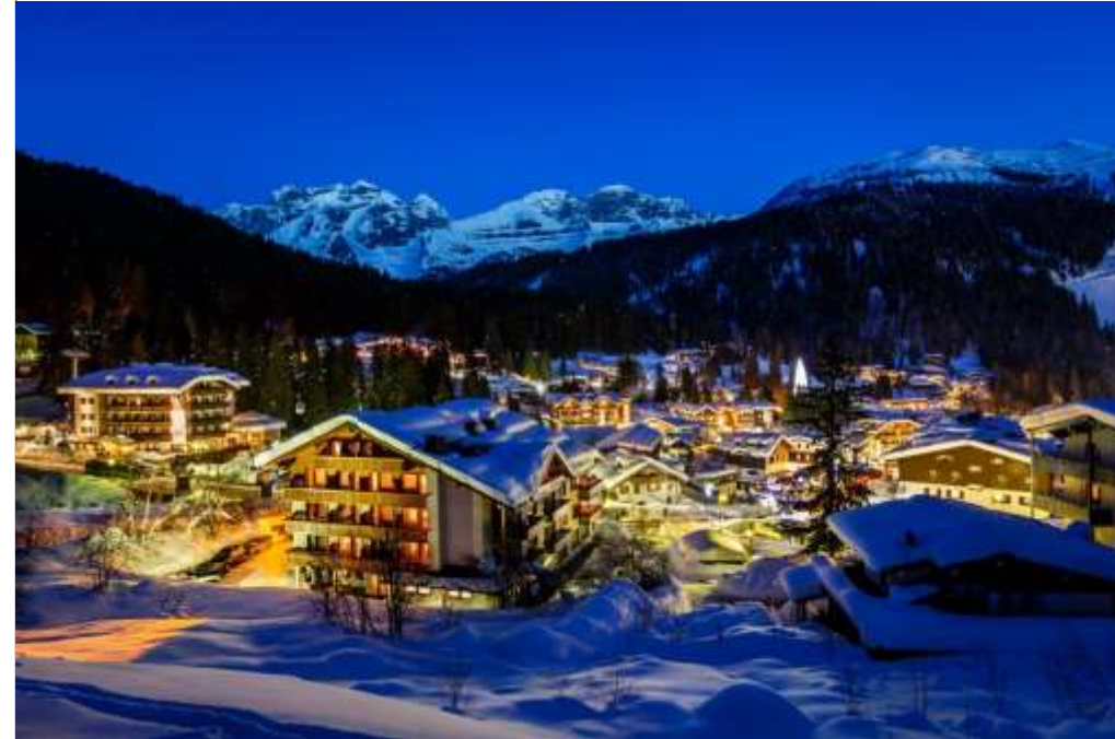
Мадонна ди Кампильо в Италии