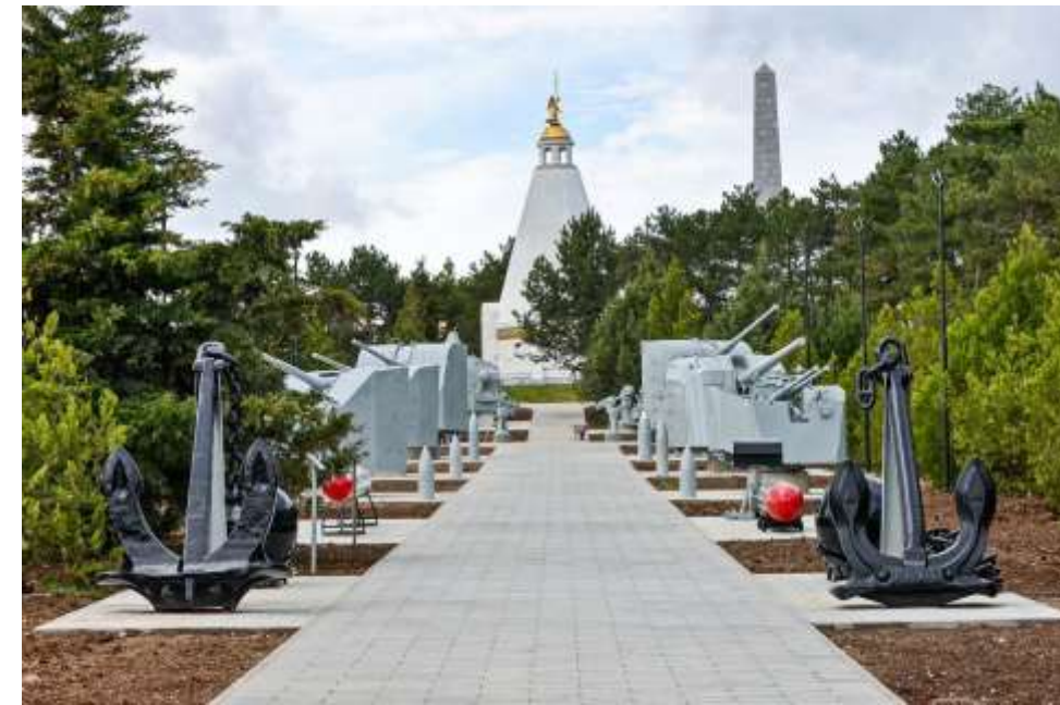
«Сапун гора» в Севастополе

Интерес представляет и военно- культурный туризм – это возможность совместить посещение боевых мест с экскурсионными программами по «традиционным» достопримечательностям, ознакомиться с бытом конкретной страны или города.