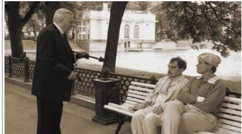
М. Булгакова «Мастер и Маргарита»