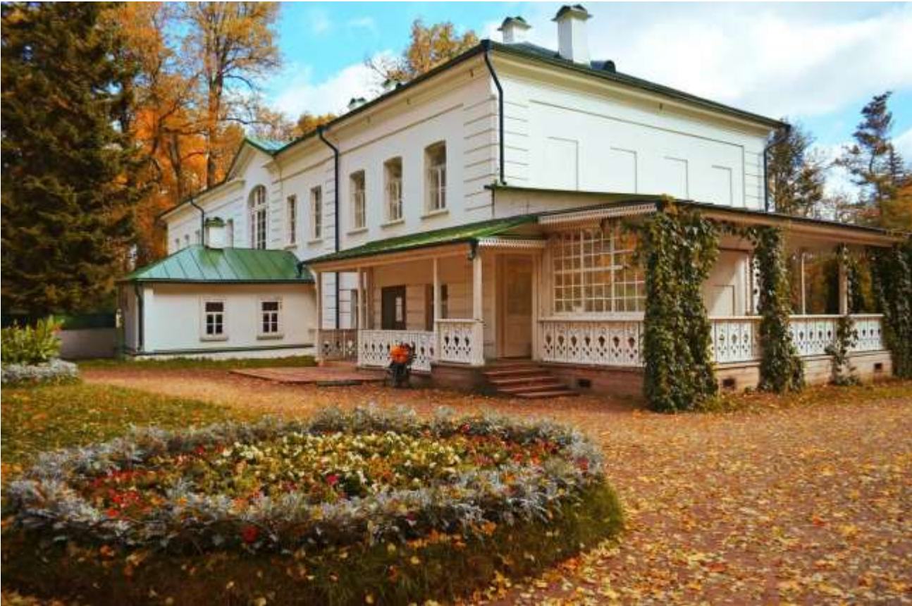
Ясная Поляна Музей