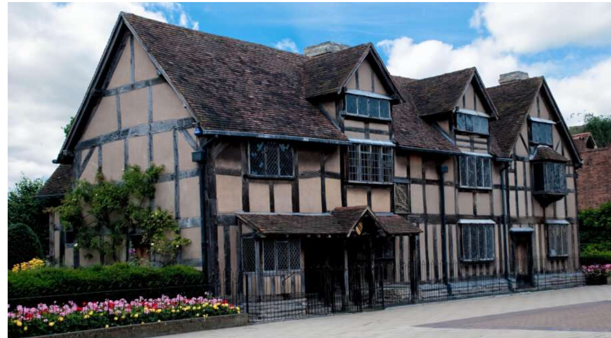
Любители Шекспира едут в Стратфорд-он-Эйвон