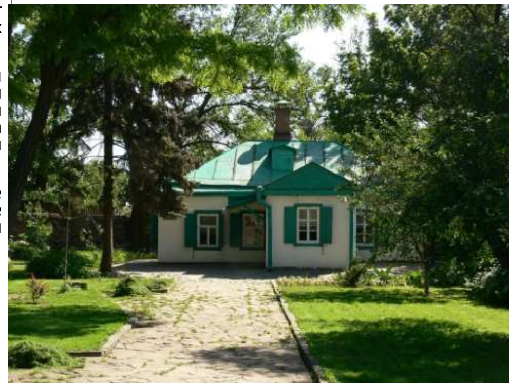
Таганрог (А.П. Чехов)

Представители первой группы отправляются в путешествие с целью почтить память любимого автора, а ключевой мотив путешествия второй группы – общий интерес. Несмотря на то, что представители второй группы могут не знать подробности жизненного пути писателя, они имеют общие представления о посещаемом объекте. Источниками материала в этом случае могут быть любые носители информации.