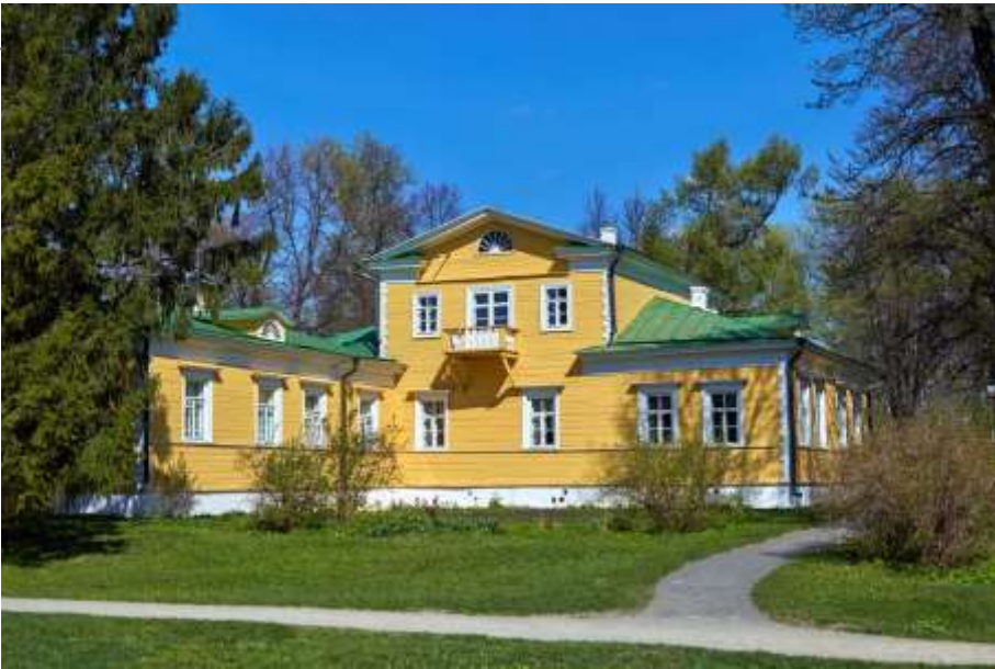
Государственный литературно-мемориальный и природный музей-заповедник А.С. Пушкина Болдино

Понятие «литературный туризм» связано с почитанием произведений мировой классики. Как правило, турист, отправляющийся по литературному маршруту, посещает места, связанные с жизнью и творческой деятельностью писателя, «адреса» его литературных героев. Основная задача туриста – исследовать города, в которых жили великие писатели или разворачивались события их произведений.