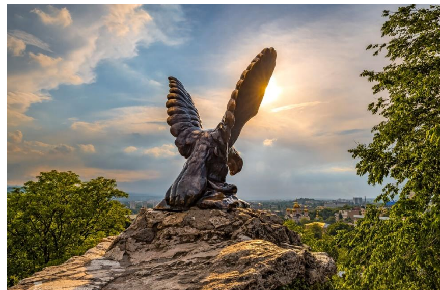
Кавказские Минеральные воды