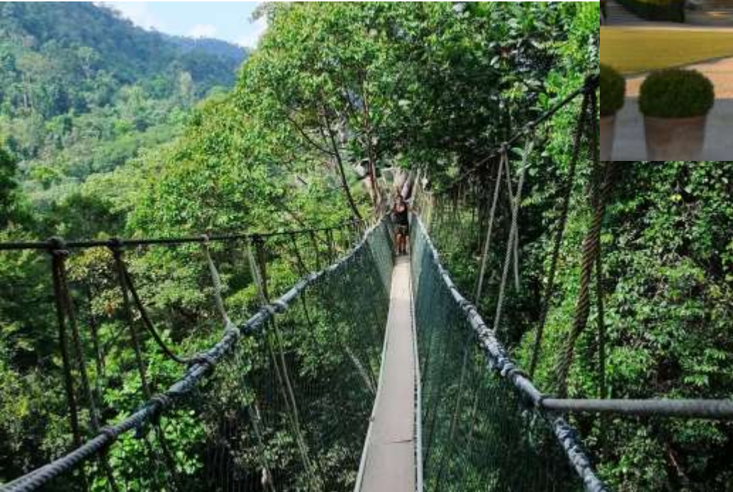
Таман-Негара, парк в Малайзии.