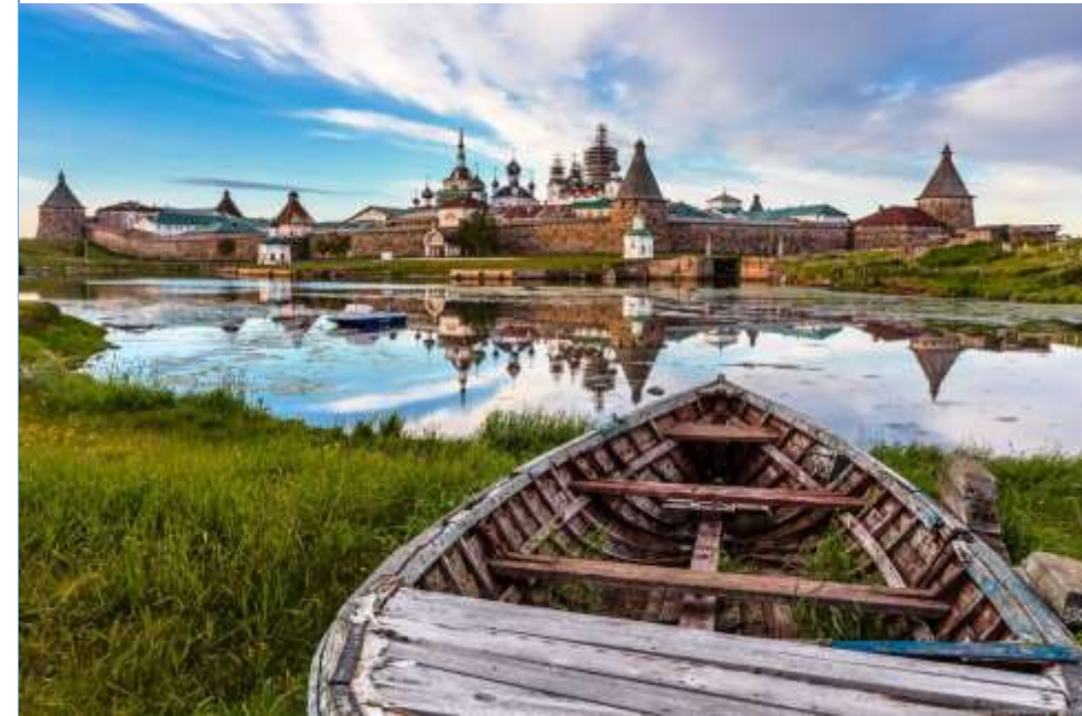
монастыри на Валааме и Соловках