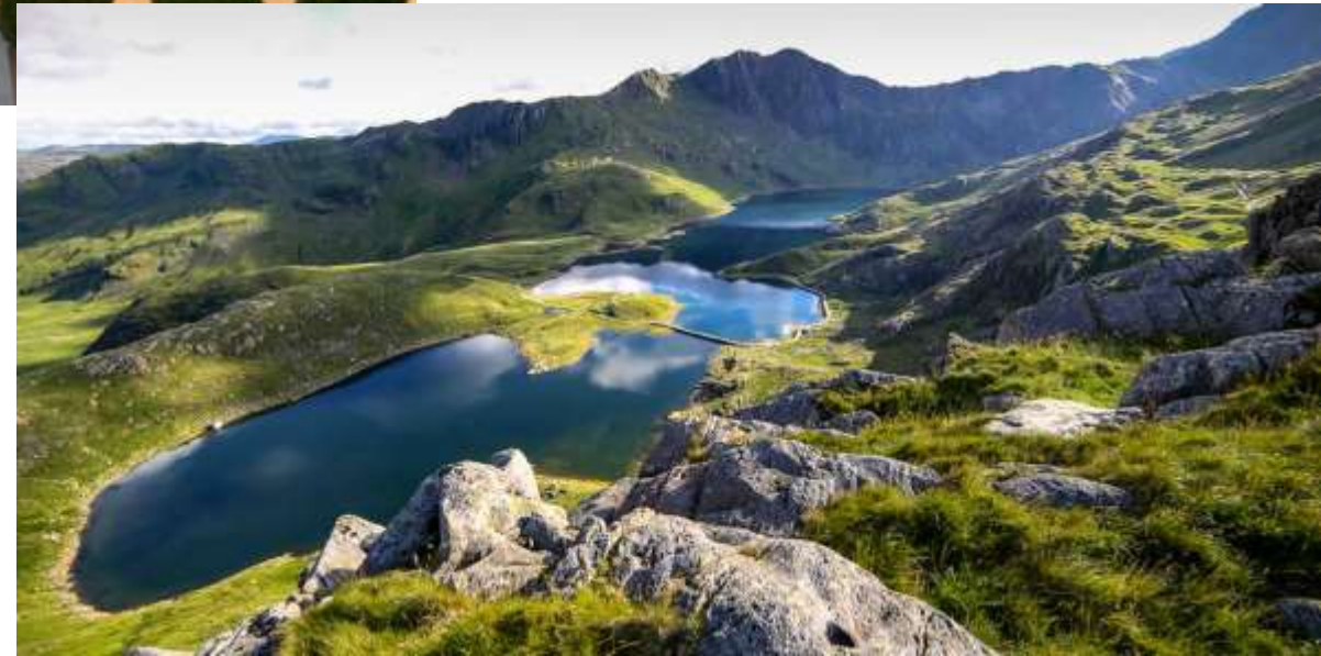
Сноудония, Север Уэльса.