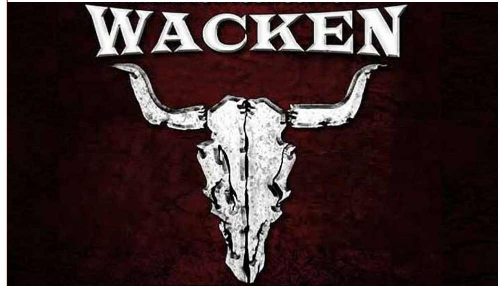
Wacken Open Air

Музыкальный туризм имеет свою специфику и узкую аудиторию. Она определяется характером мероприятия и музыкальным направлением. Но ошибочно полагать, что подобные шоу посещают только молодые люди. На фестивале джаза или серьёзной музыки можно встретить туристов с сединой и в возрасте. Часто в такие туры отправляются за компанию, делая приятное своему спутнику, жениху или близкому другу. Но эти мероприятия всегда посещают те, кто не гонится за экономией, бросовыми предложениями и распродажами от туристических операторов.