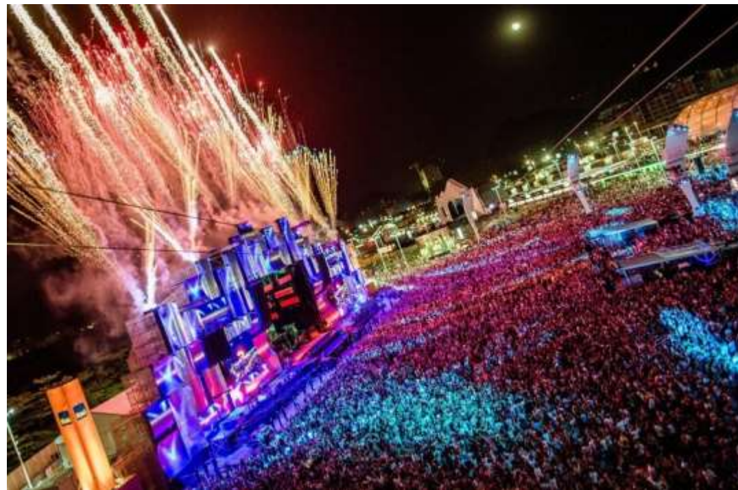
“Рок в Рио-де-Жанейро”

Музыкальные конкурсы и фестивали принято проводить во всех уголках планеты. Это может быть Америка, Индия или острова в Тихом океане. У туриста будет идеальный повод посетить малознакомое место с двойной выгодой. Ведь существуют неизвестные уголки, которые заслуживают нашего внимания. Путешественник окунётся в мир своей любимой музыки и узнает много интересного об этой местности. Случается так, что слушатель раскрывает для себя новые стороны определённого музыкального направления. А атмосфера и позитивная аура дают прилив творческих сил и вдохновения.