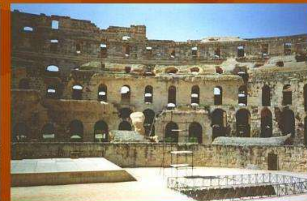
Древнеримский амфитеатр (Тунис)