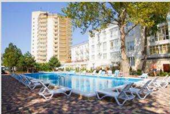
Анапа (Краснодарский край)