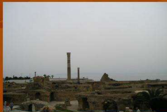
Тунис. Развалины финикийского города Карфаген