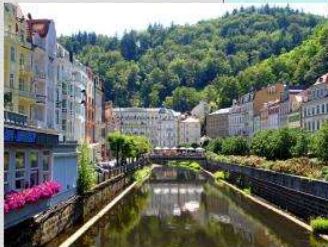
Карлови Вари (Чехия)