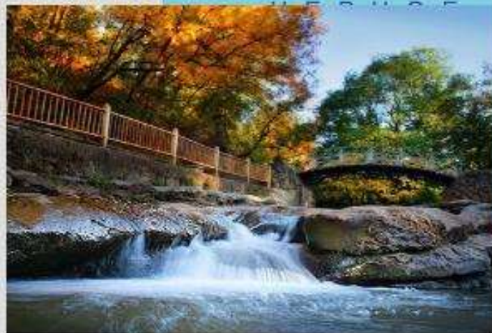
Кисловодск (Кавказские Минеральные Воды)