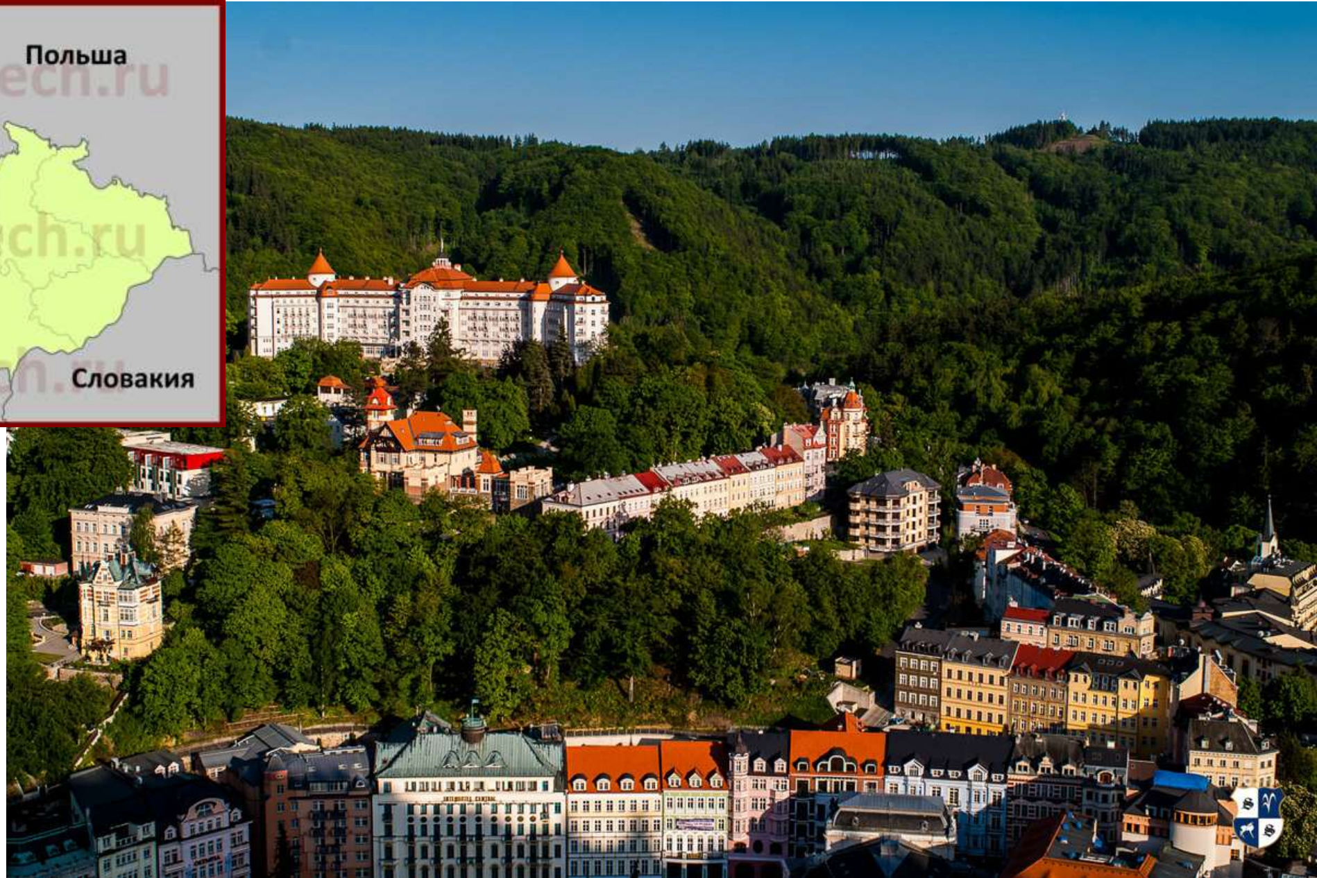
курорт Карловы Вары