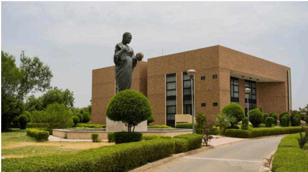
Чадский Национальный музей