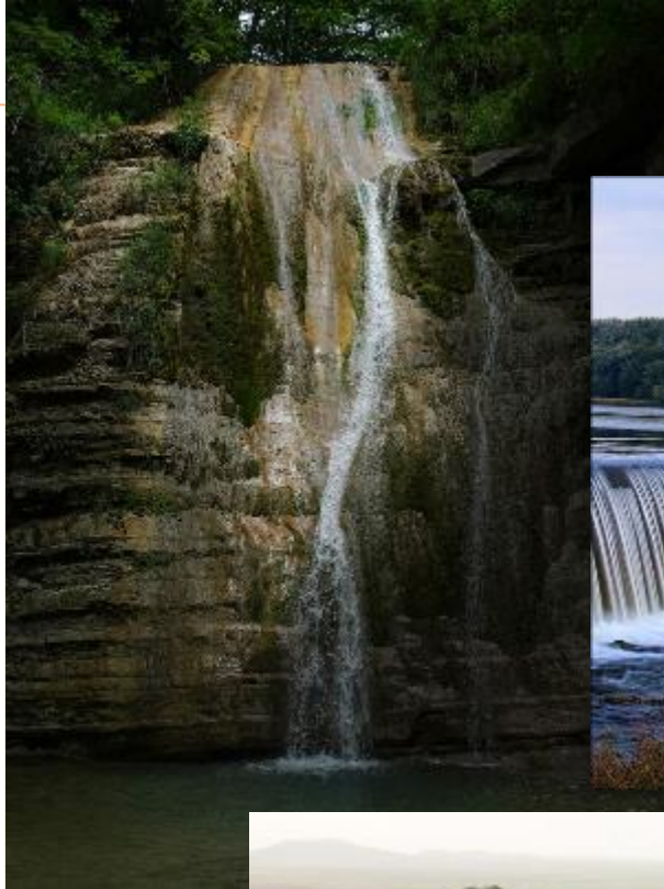
Водопад на реке Котт