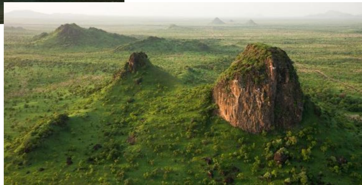
национальные парки Андре-Феликс