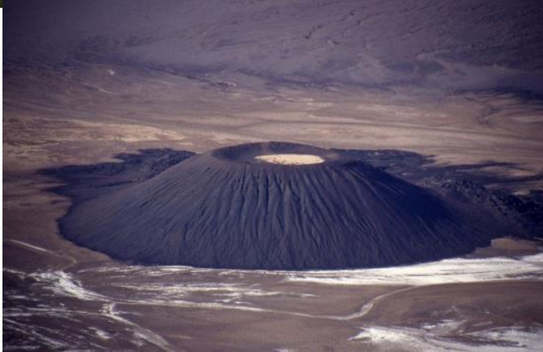
Вулкан Тарсо Вун