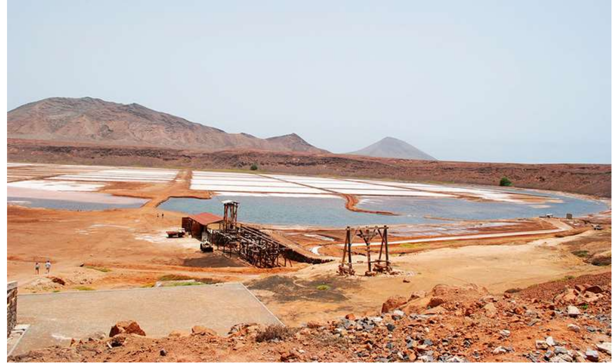
Соляной кратер Педра-де-Люме

Одно из главных туристических мест на острове Сал — соляные бассейны Педра-де-Люме. В 1833 году в этом месте из недр земли извлекали сам природный минерал. Разноцветные емкости, старые складские помещения и деревянные остовы приспособлений для транспортировки еще видны то тут, то там.