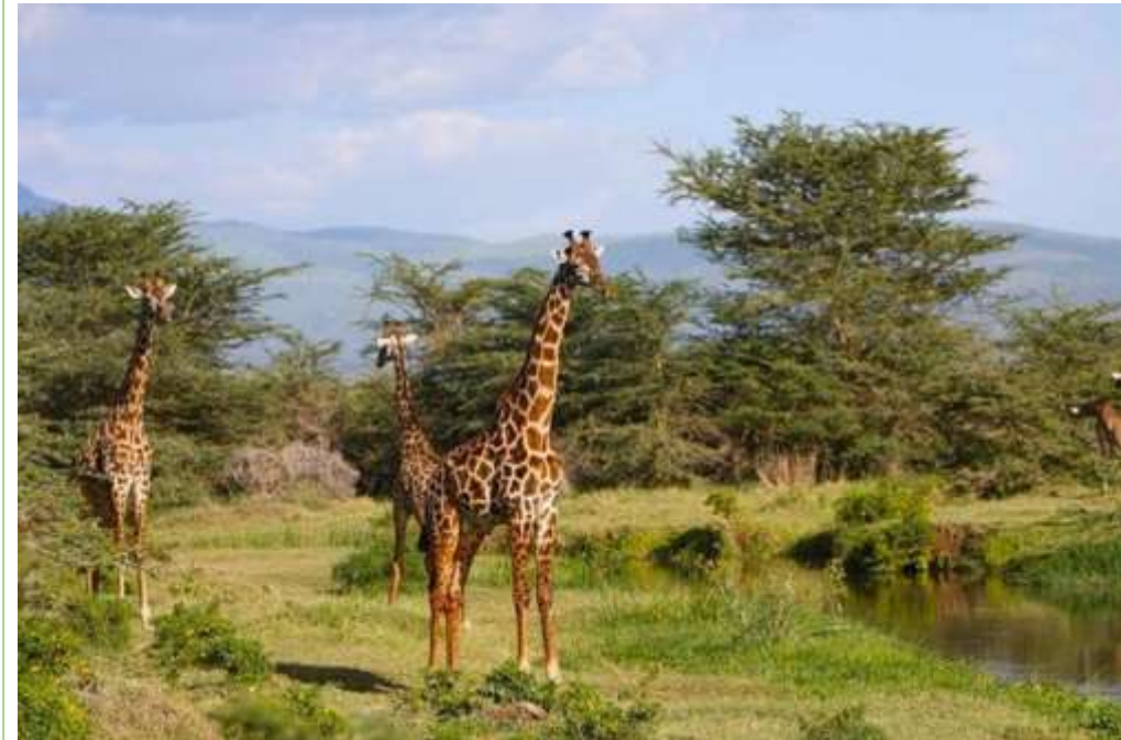
национальный парк Бауле