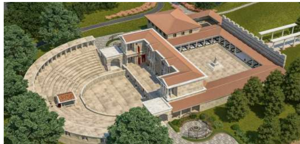
Болгария – Исторический парк Неофит Рилски