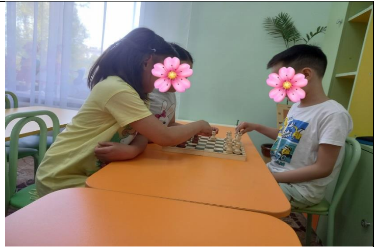
Шашки и шахматы

Уголок художественного творчества «Волшебные карандаши»