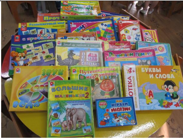
Дидактические игры и паззлы