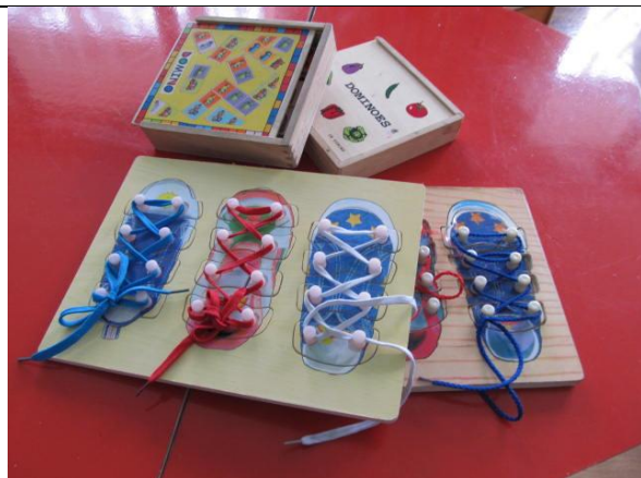
Игры – шнуровки и лото