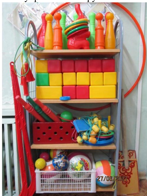
Оборудование для общеразвивающих упражнений в группе