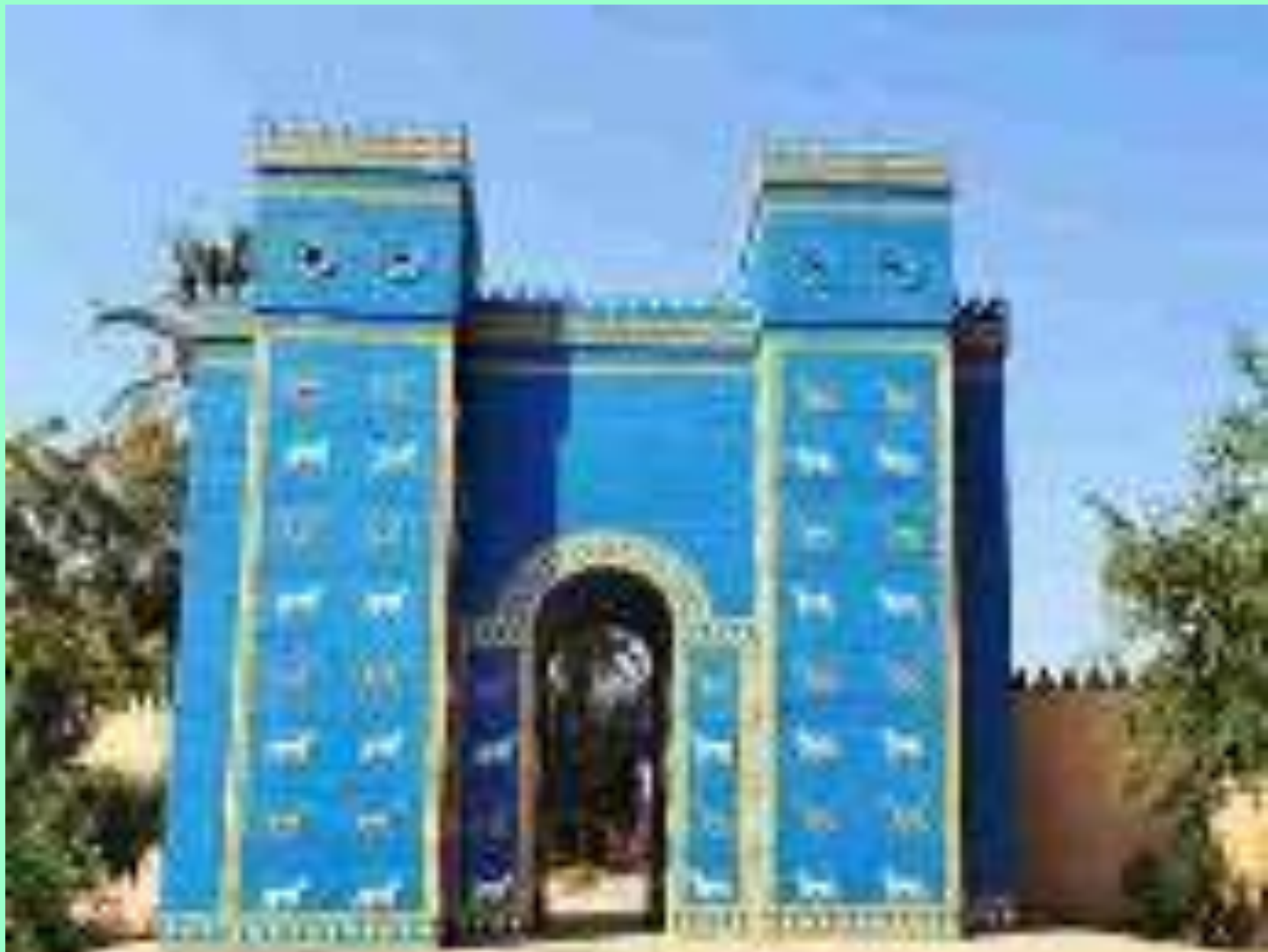
Ворота богини любви и плодородия Иштар