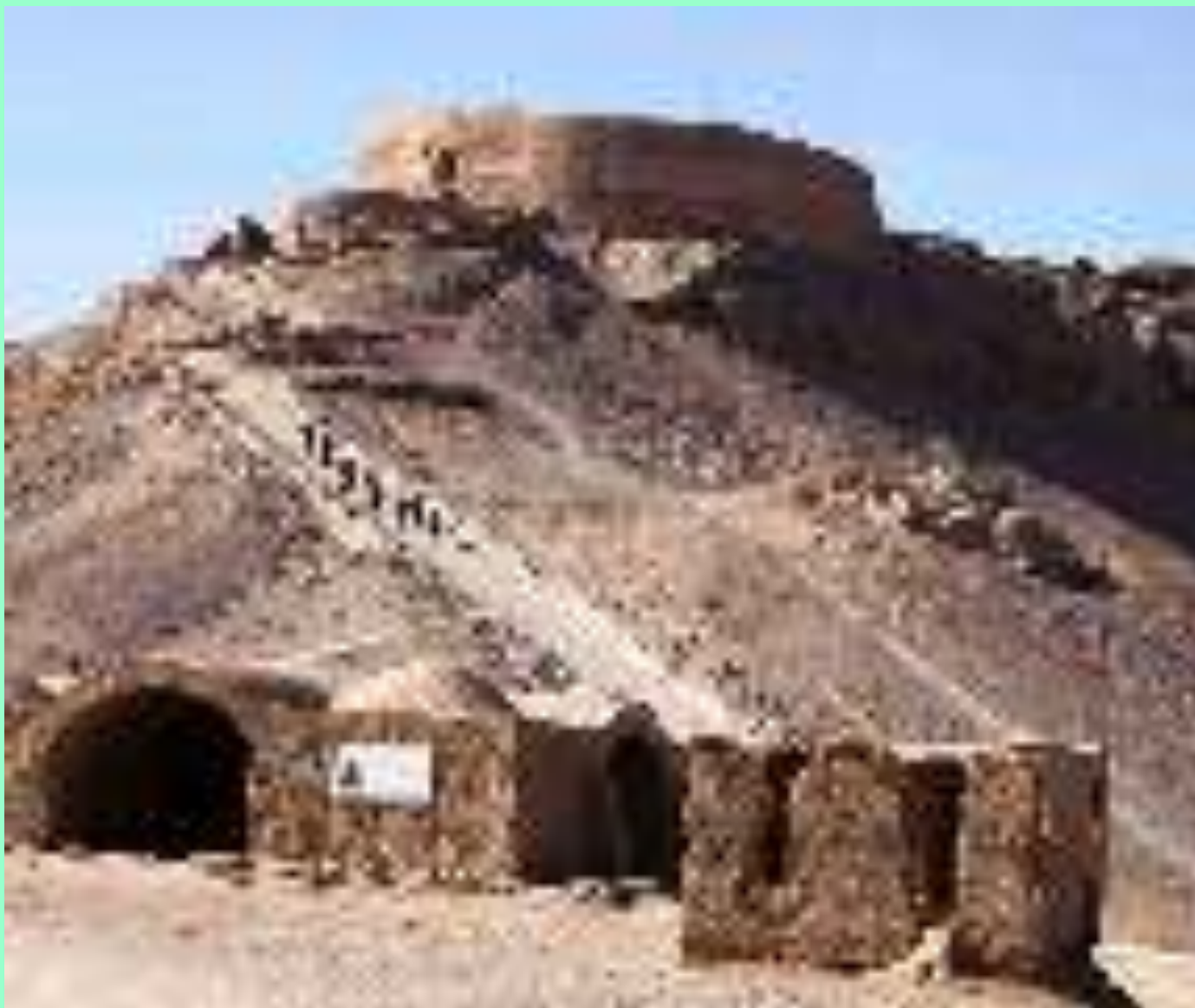
Башни молчания Иран