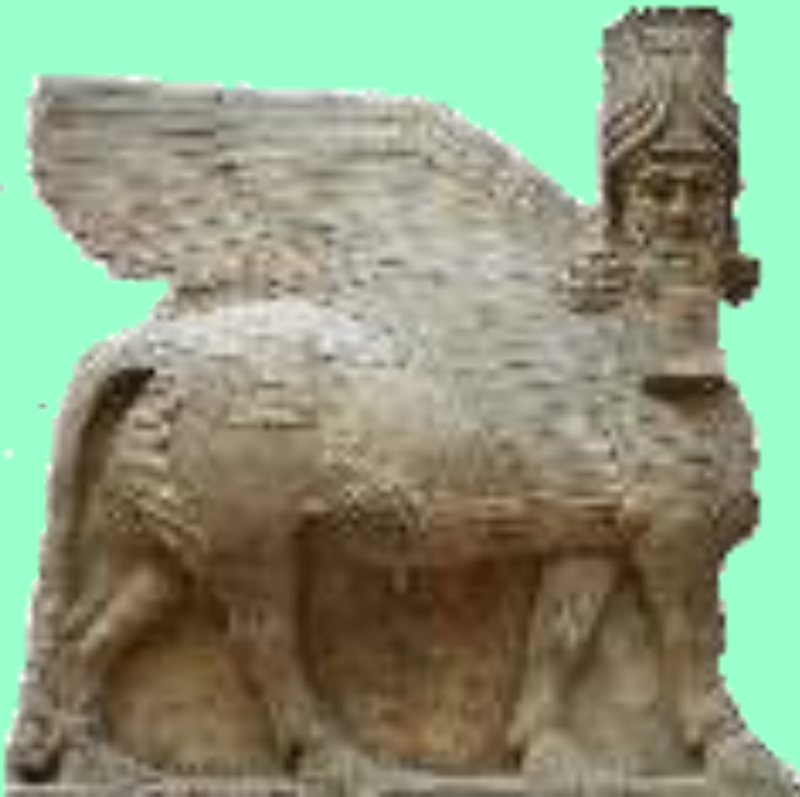
Крылатый бык Шеду из дворца царя Саргона II.