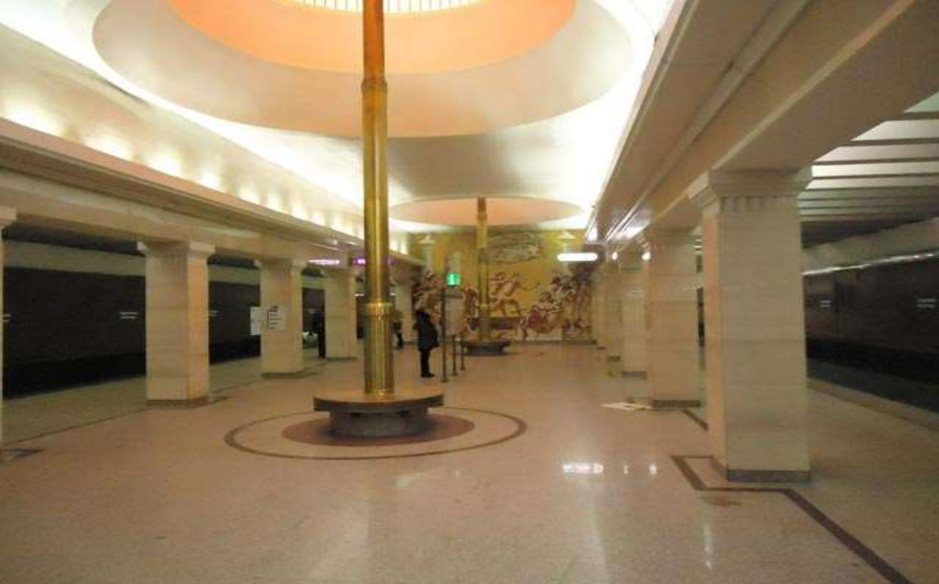
СТАНЦИЯ МЕТРО «СПОРТИВНАЯ»