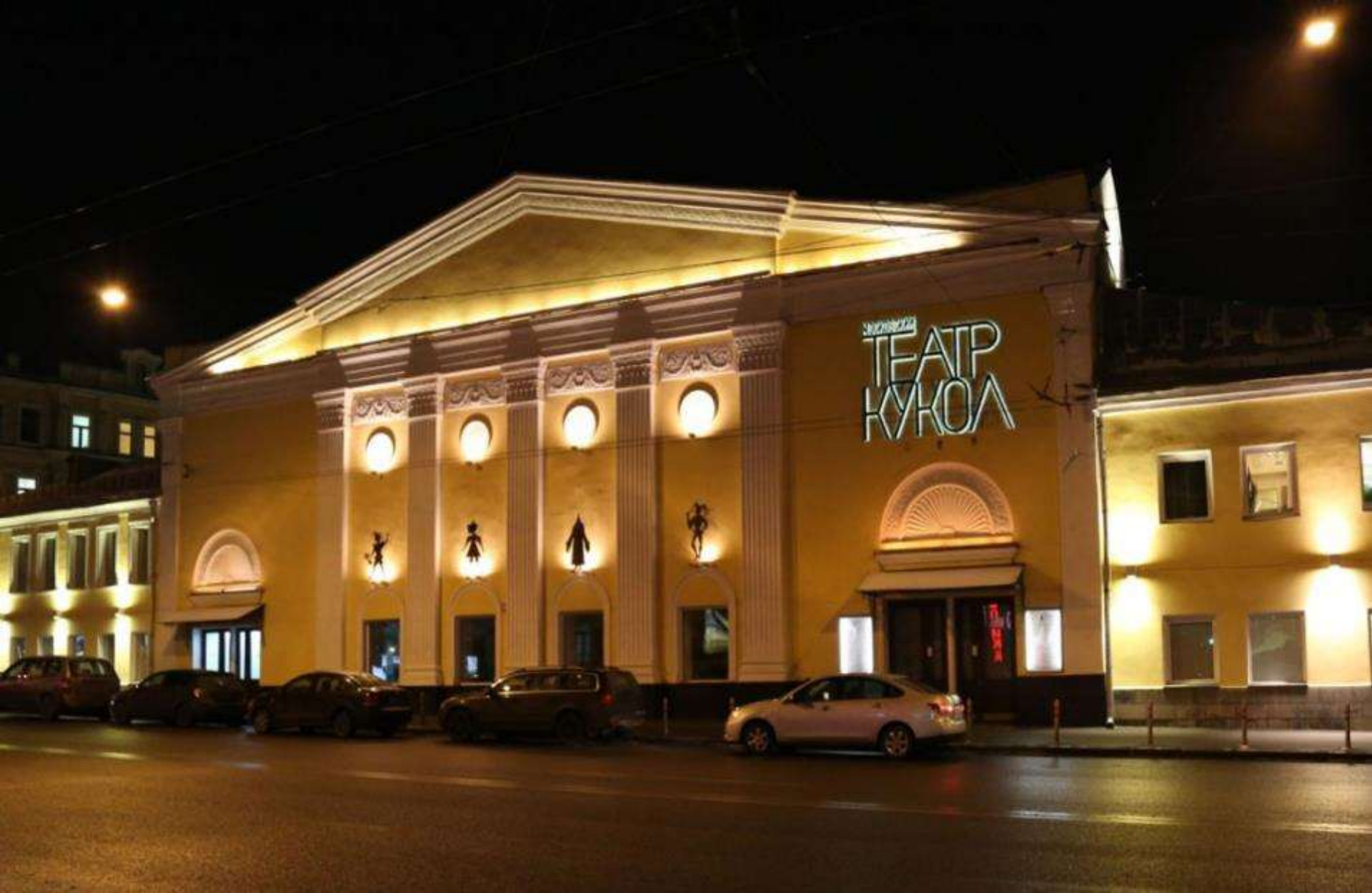
МОСКОВСКИЙ ТЕАТР КУКОЛ