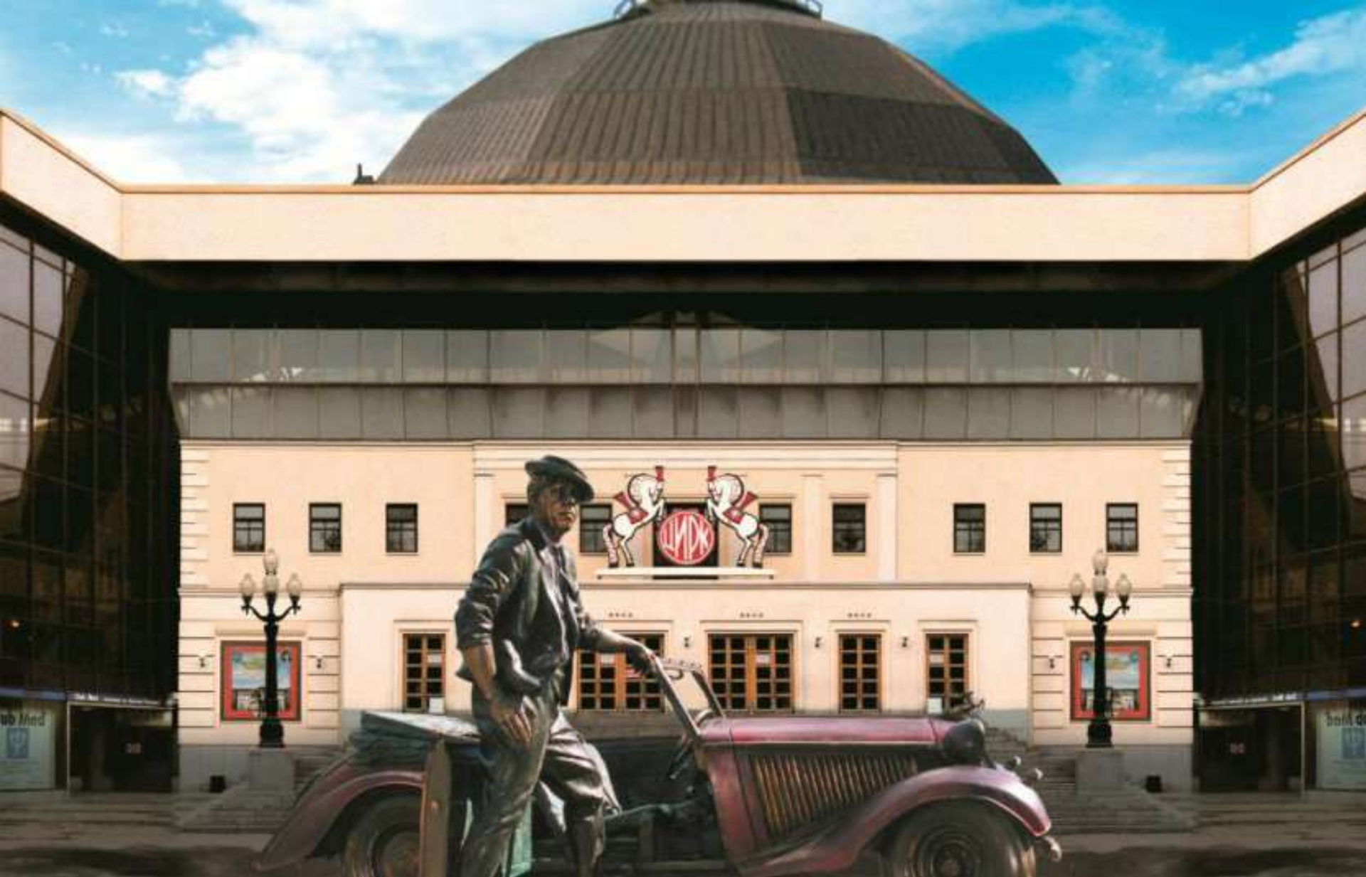
ЦИРК НИКУЛИНА НА ЦВЕТНОМ БУЛЬВАРЕ