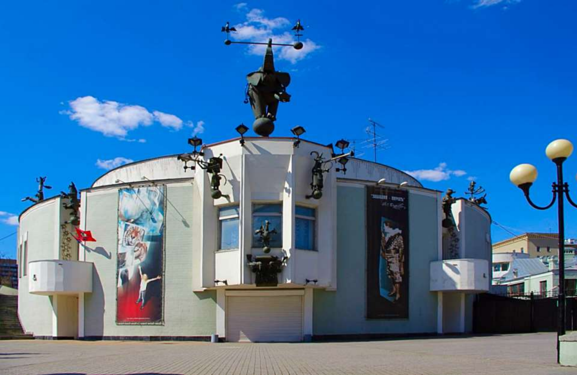
УГОЛОК ДЕДУШКИ ДУРОВА