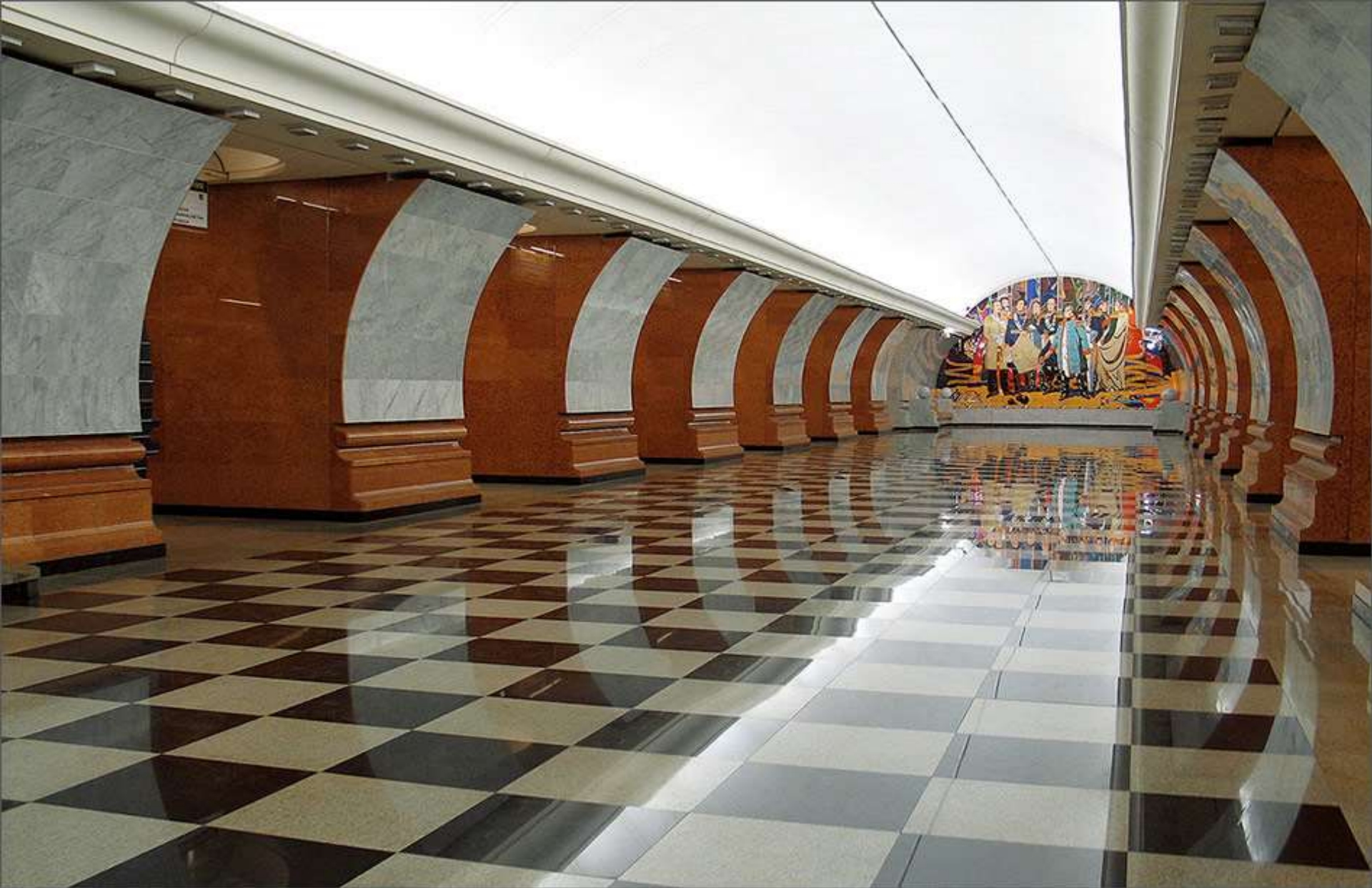
СТАНЦИЯ МЕТРО «ПАРК ПОБЕДЫ»