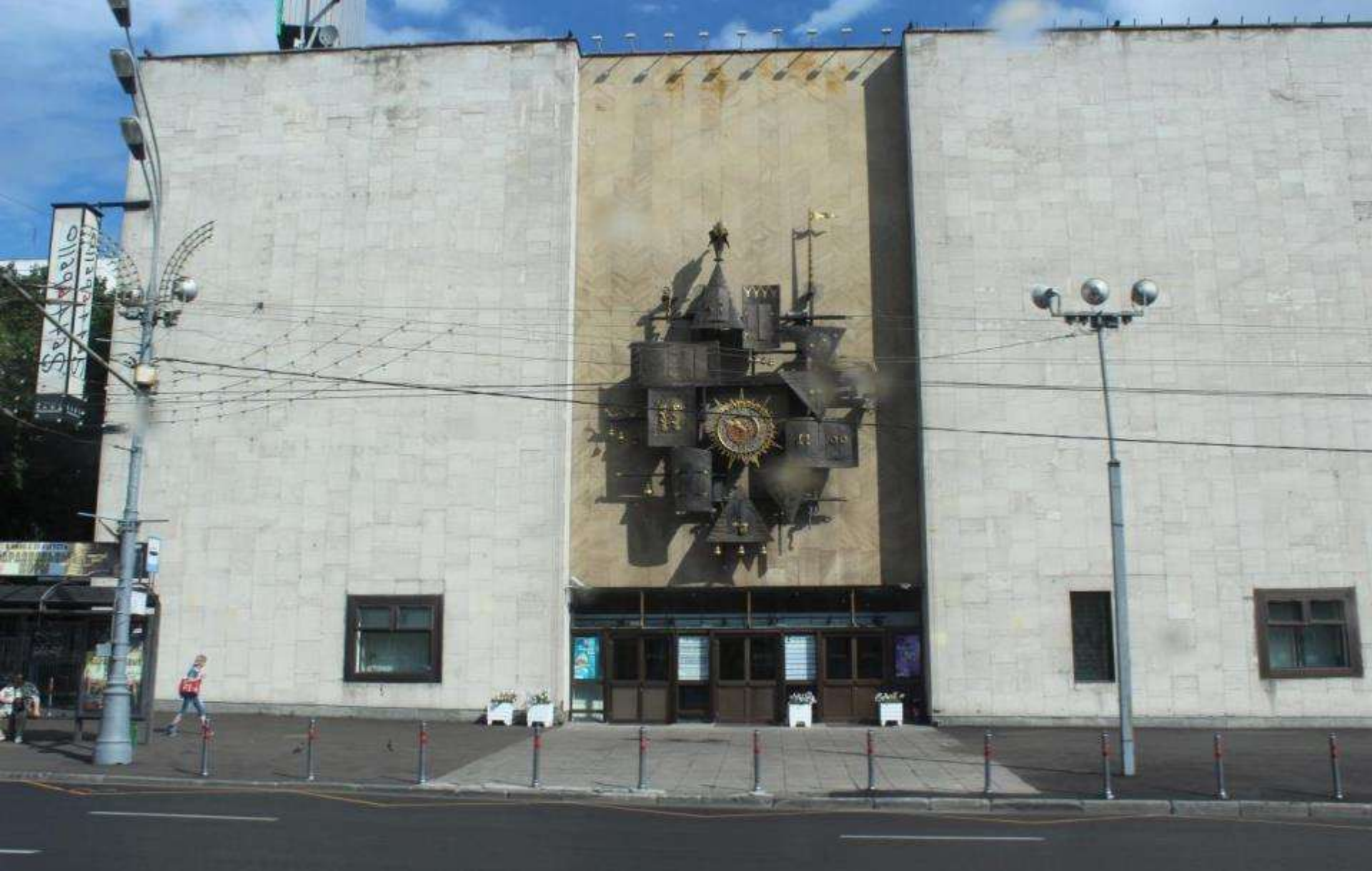
ТЕАТР КУКОЛ ИМЕНИ ОБРАЗОВА