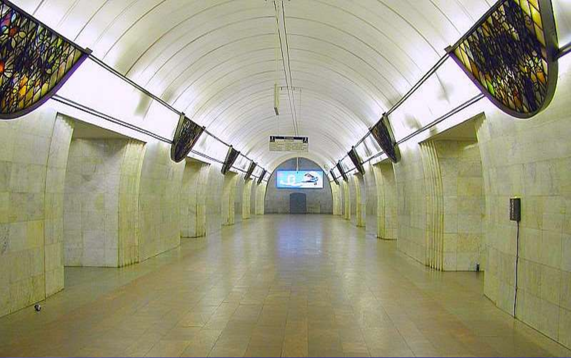
СТАНЦИЯ МЕТРО «ЦВЕТНОЙ БУЛЬВАР»