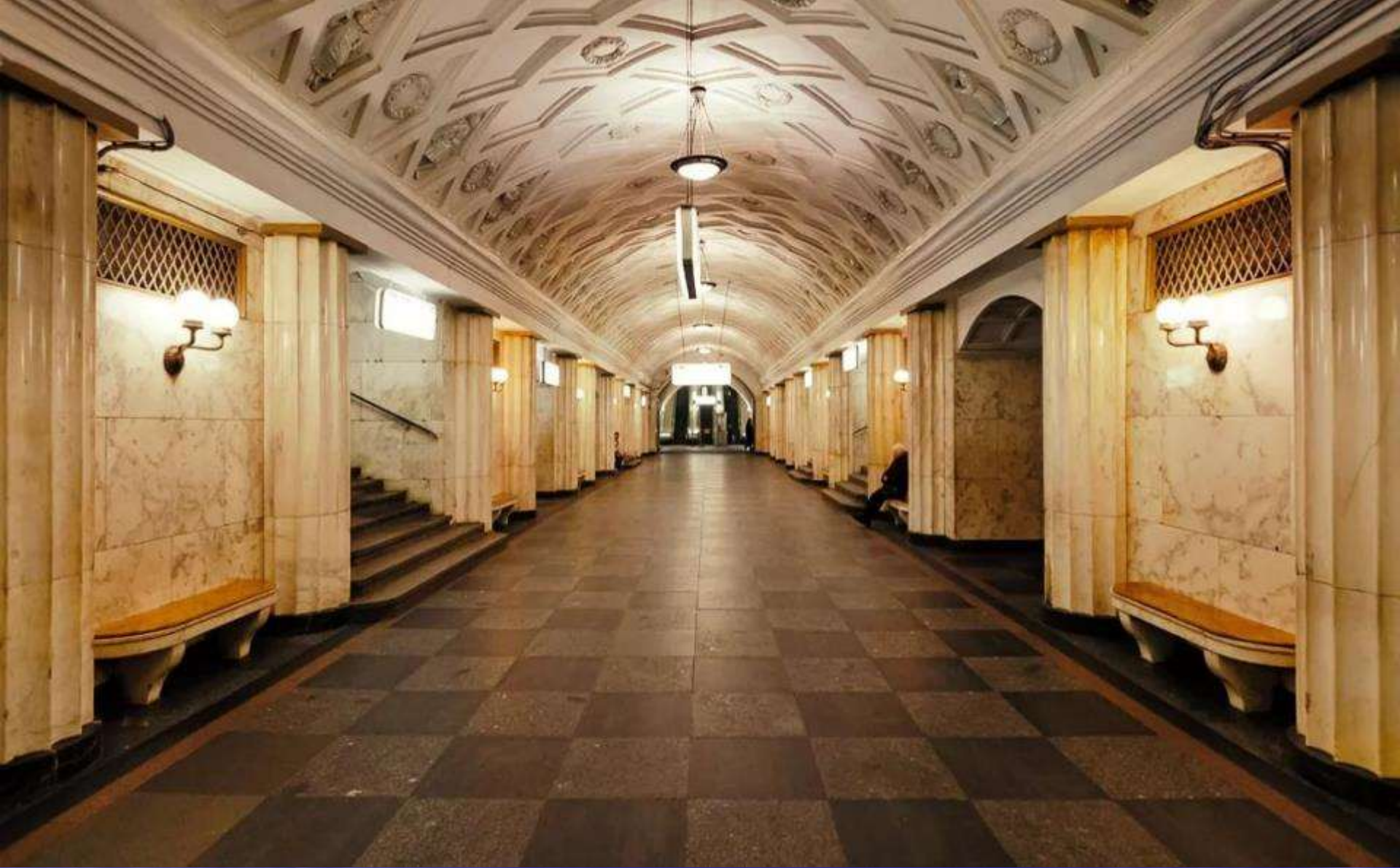
СТАНЦИЯ МЕТРО «ТЕАТРАЛЬНАЯ»