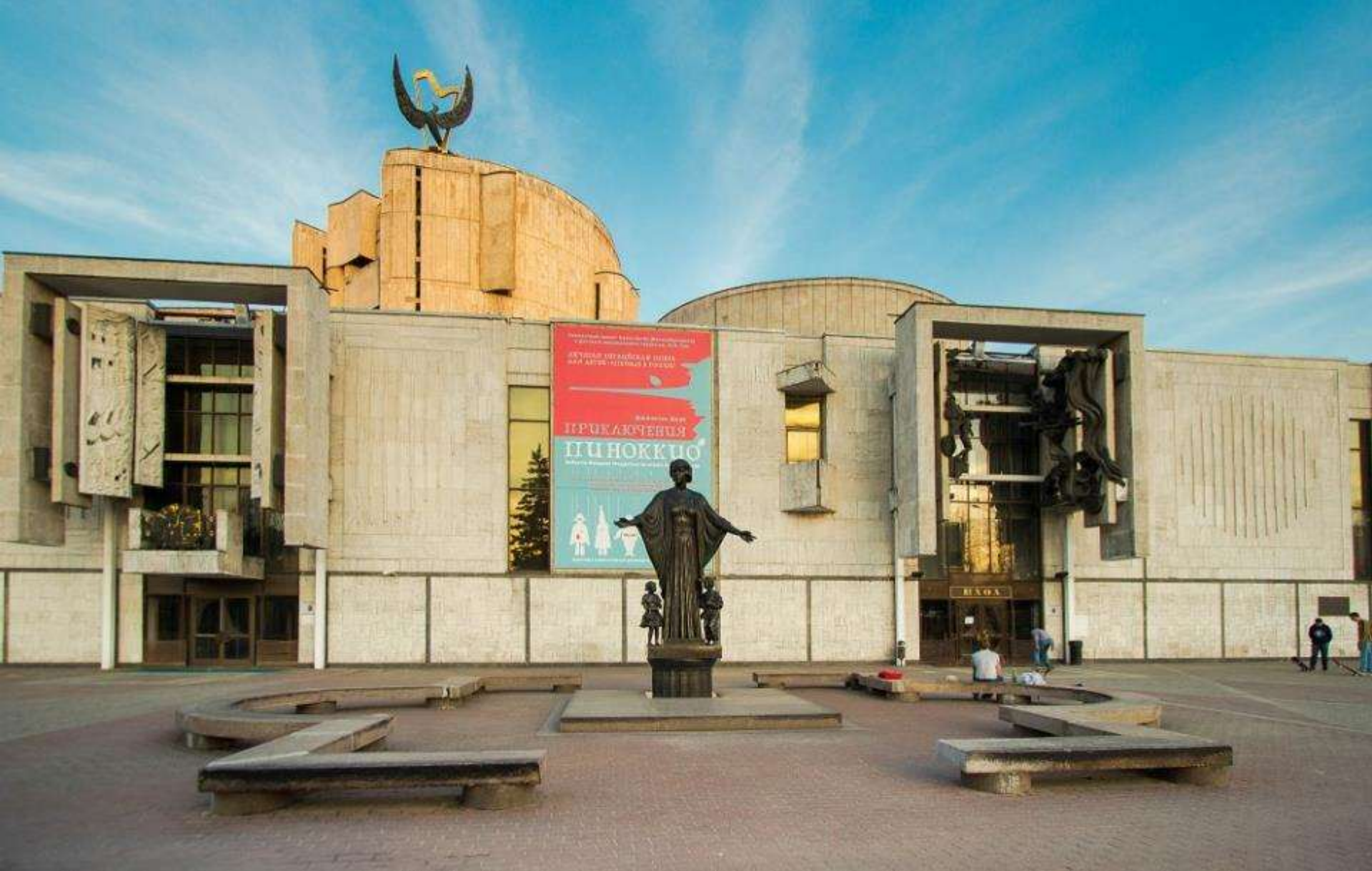
МУЗЫКАЛЬНЫЙ ТЕАТР ИМЕНИ Н.И. САЦ