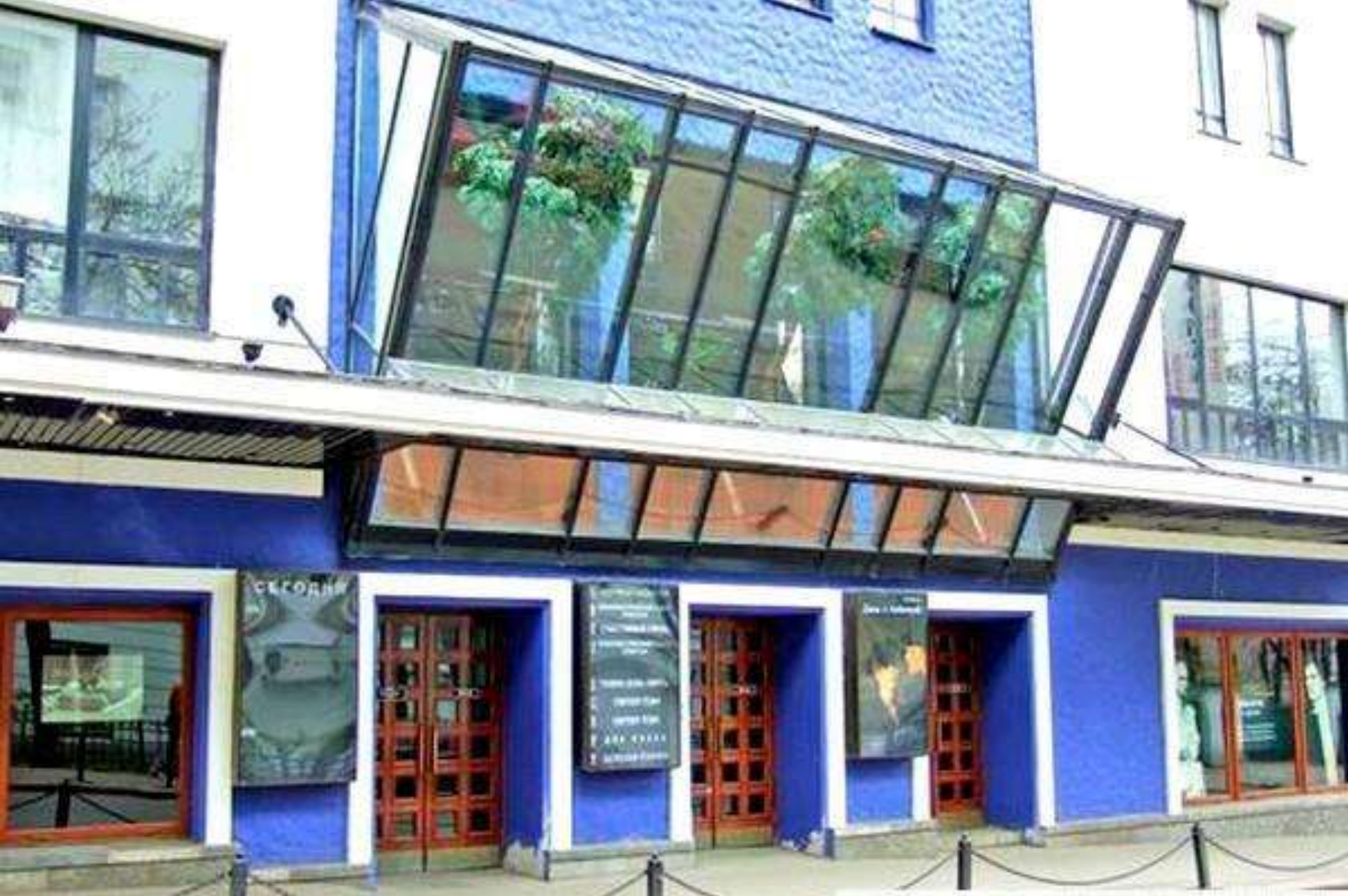
МОСКОВСКИЙ ТЕАТР ЮНОГО ЗРИТЕЛЯ (ТЮЗ)