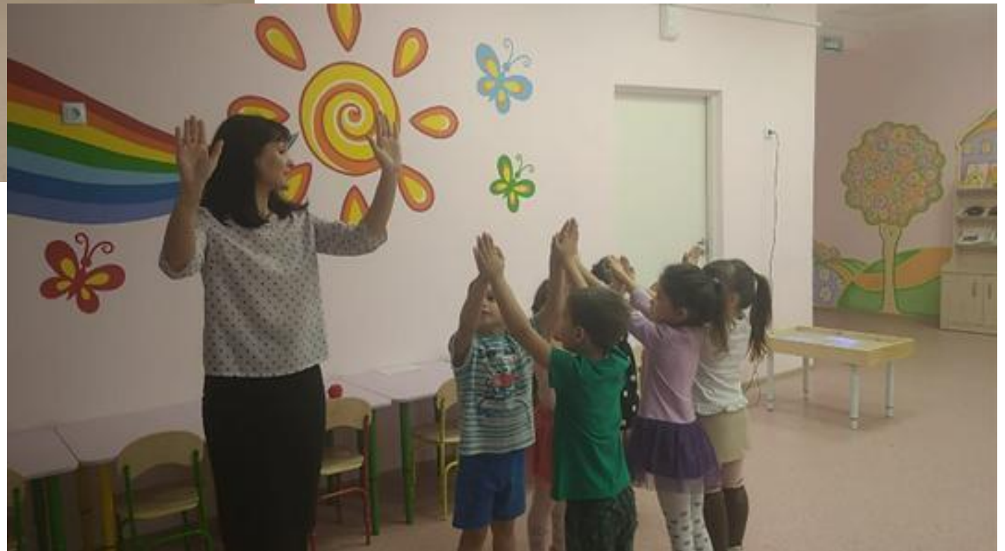
Упражнение «Мостик дружбы»