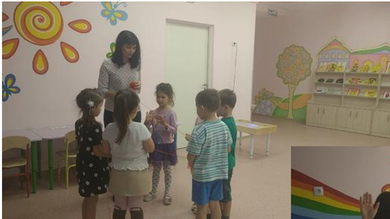
Упражнение «Связующая нить»