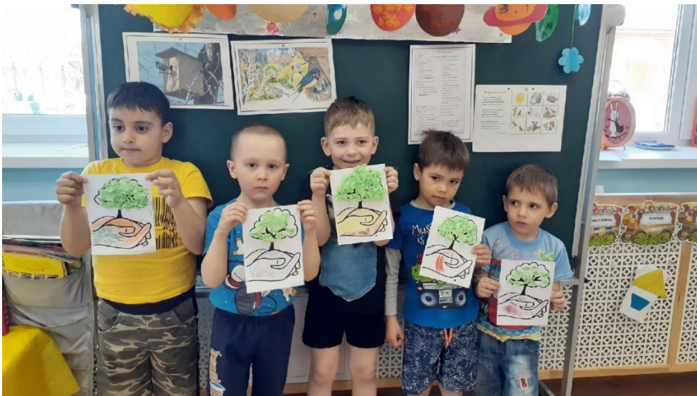
Выполнение аппликации к празднику « День Земли»