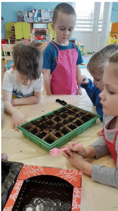
Все дети активно участвовали в посадке лука и цветов.