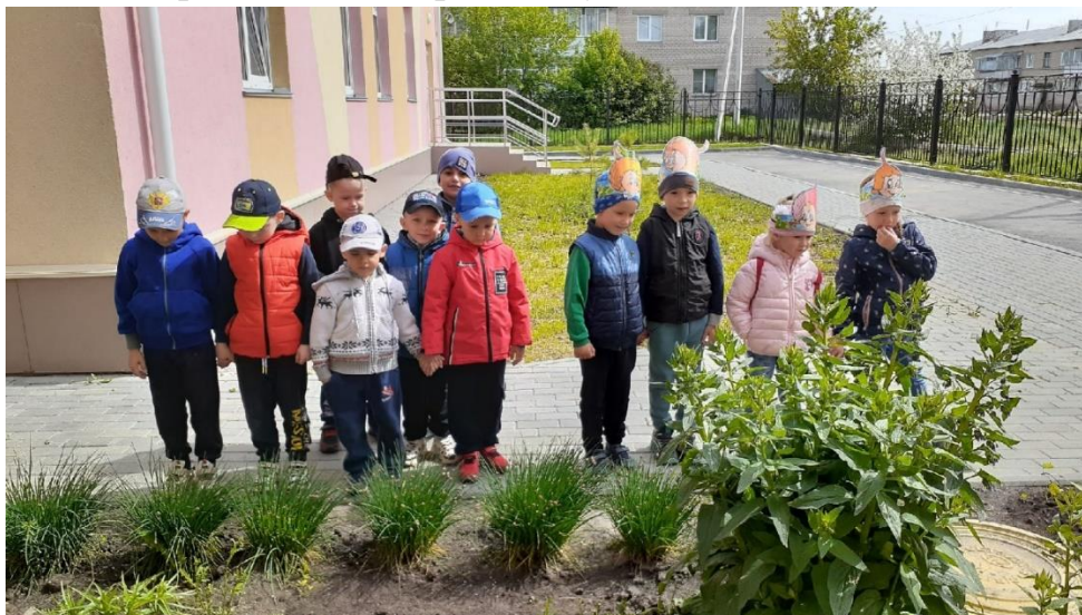
Наблюдение за ростом цветов на нашей клумбе.