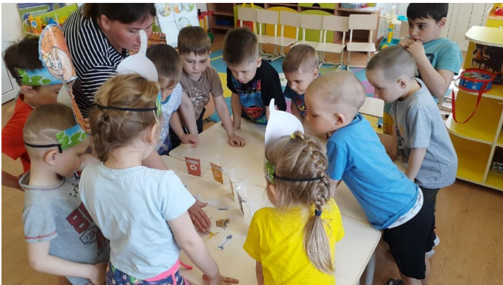
Проведение дидактической игры «Рассортируй мусор» Так же мы устраивали с детьми «Дни чистоты» на нашем участке.