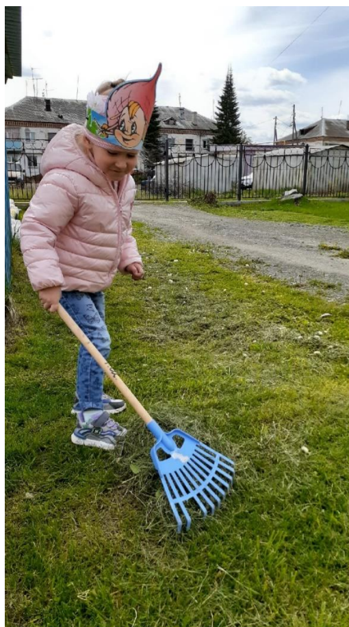
В мае сбор скошенной травы на участке.