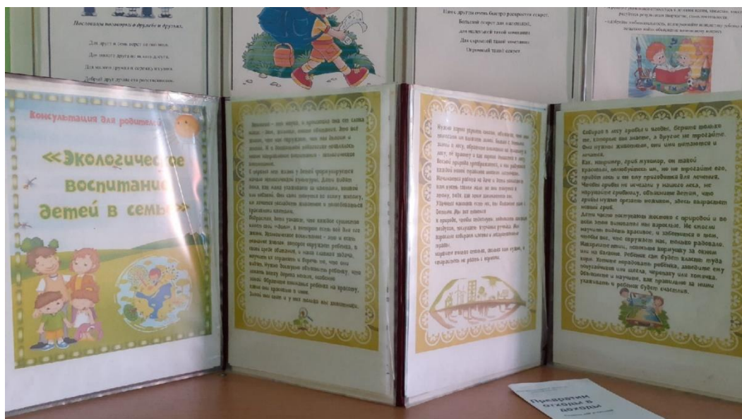
В родительский уголок подготовила папку-передвижку на тему: «Экологическое воспитание детей в семье»