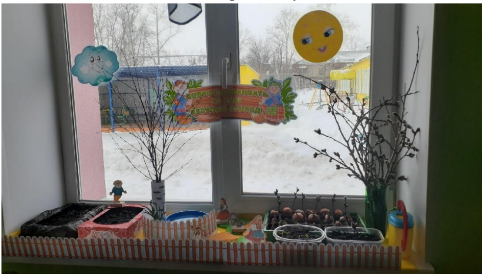
Совместно с детьми мы оформили огород на подоконнике.