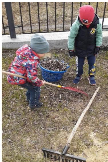
Весной дети помогали в чистке участка, сбор сухих листьев, сухих веток на территории участка.