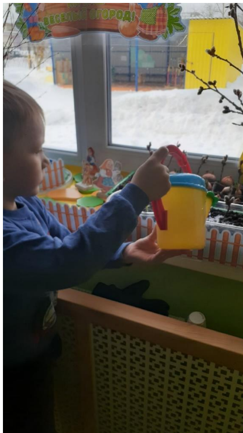
Наблюдали за ростом растений, ухаживали за ними, поливали.