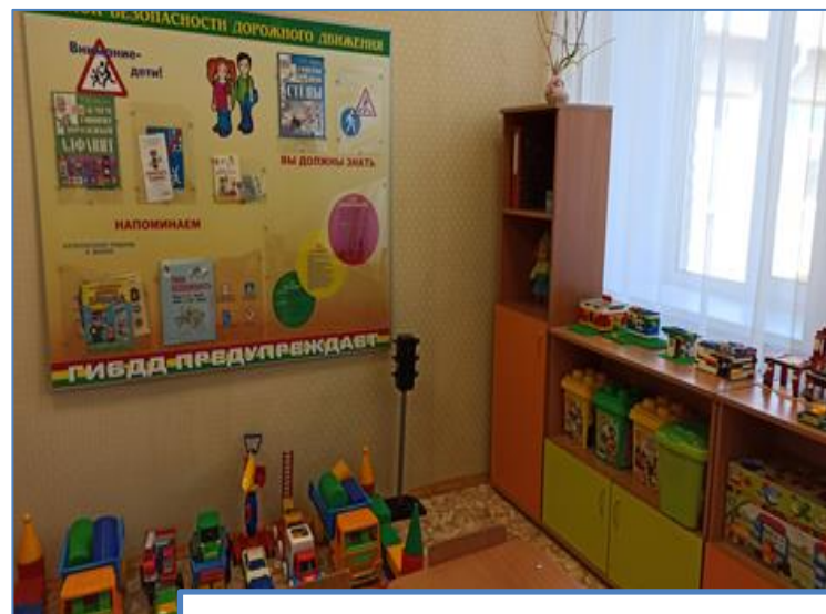
Функциональный модуль «Безопасность»