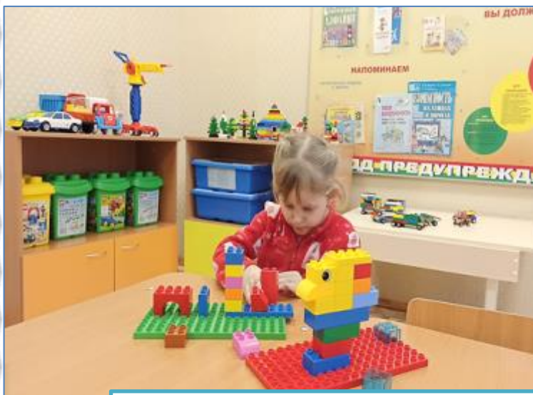
Функциональный модуль «Творчество»

Моделирование и паспортизация РППС по функциональным модулям с учетом особенностей организации и содержания образовательной деятельности в контексте образовательных программ дошкольного образования, материально-технических условий, в том числе для детей с ОВЗ (воспитанники с ТНР)