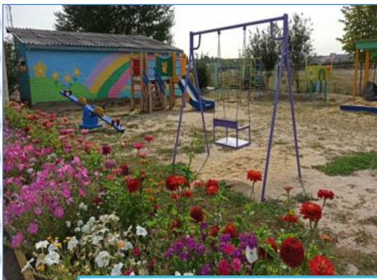
Функциональный модуль «Уличное пространство»

Моделирование и паспортизация РППС по функциональным модулям с учетом особенностей организации и содержания образовательной деятельности в контексте образовательных программ дошкольного образования, материально-технических условий, в том числе для детей с ОВЗ (воспитанники с ТНР)