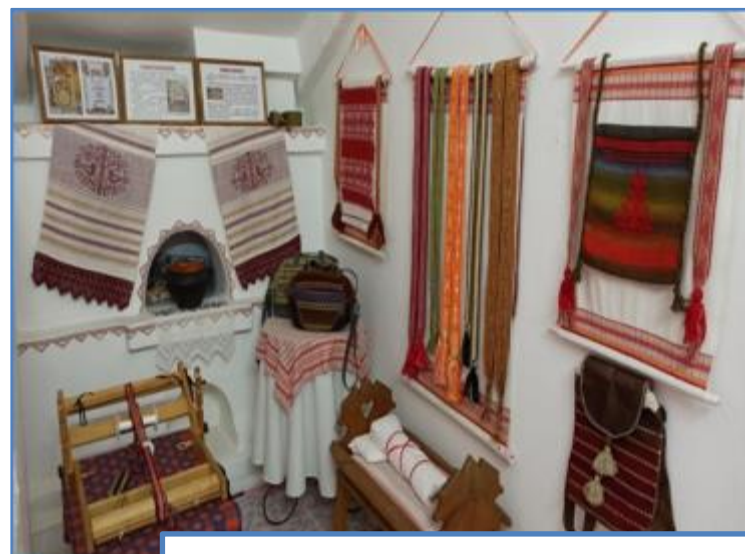
Функциональный модуль «Русская изба»