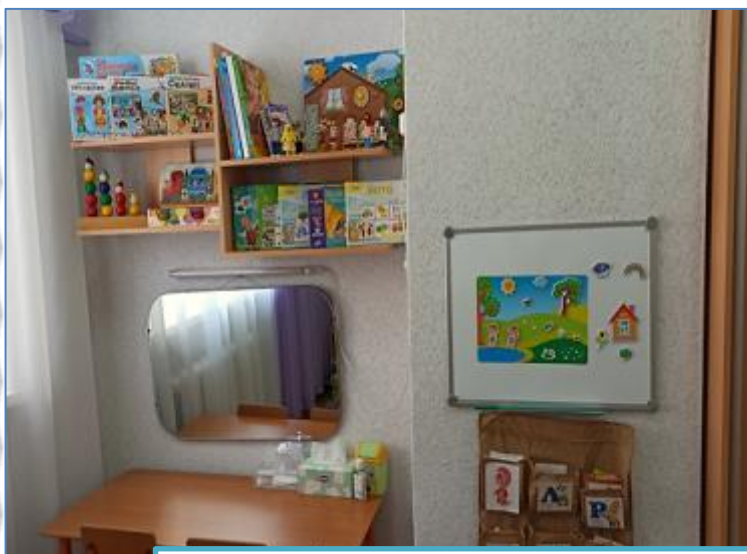
Функциональный модуль «Логопед»

Моделирование и паспортизация РППС по функциональным модулям с учетом особенностей организации и содержания образовательной деятельности в контексте образовательных программ дошкольного образования, материально-технических условий, в том числе для детей с ОВЗ (воспитанники с ТНР)