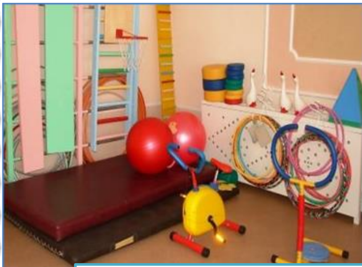
Функциональный модуль «Физкультура»

Моделирование и паспортизация РППС по функциональным модулям