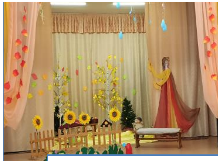
Функциональный модуль «Музыка»