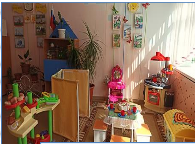
Функциональный модуль «Игровая»

Моделирование и паспортизация РППС по функциональным модулям с учетом особенностей организации и содержания образовательной деятельности в контексте образовательных программ дошкольного образования, материально-технических условий, в том числе для детей с ОВЗ (воспитанники с ТНР)