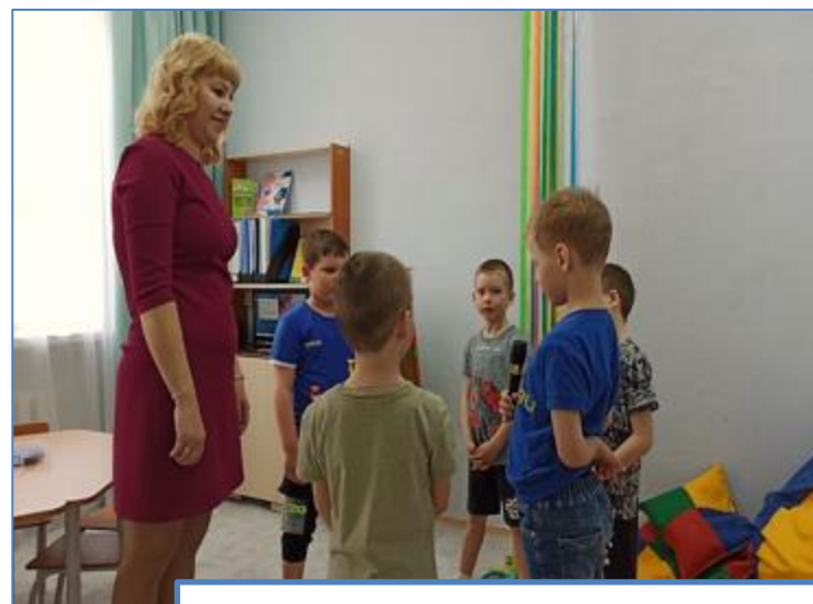
Функциональный модуль «Психолог»