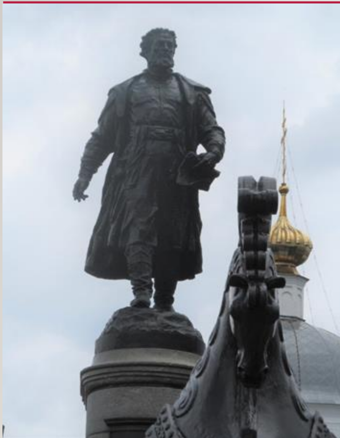
Памятник Афанасию Никитину в Твери