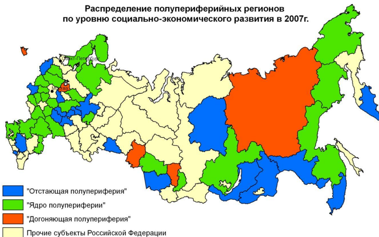
Распределение полупериферийных регионов по уровню социально-экономического развития в 2007г.