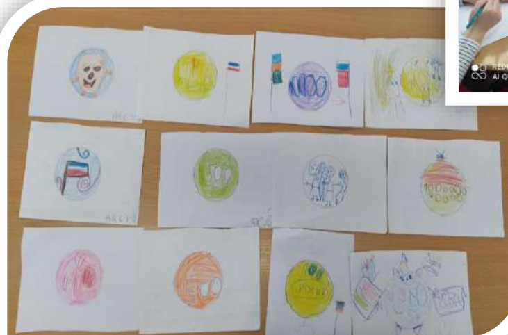
Рисование «Монета будущего»