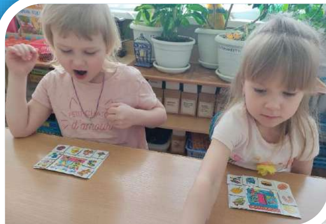
«Мы играем в магазин!»