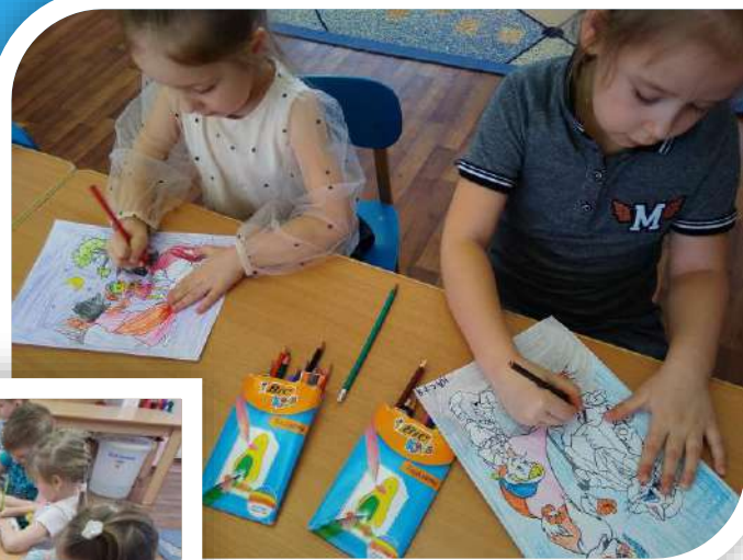
Раскраска «Как Буратино монетку посадил»