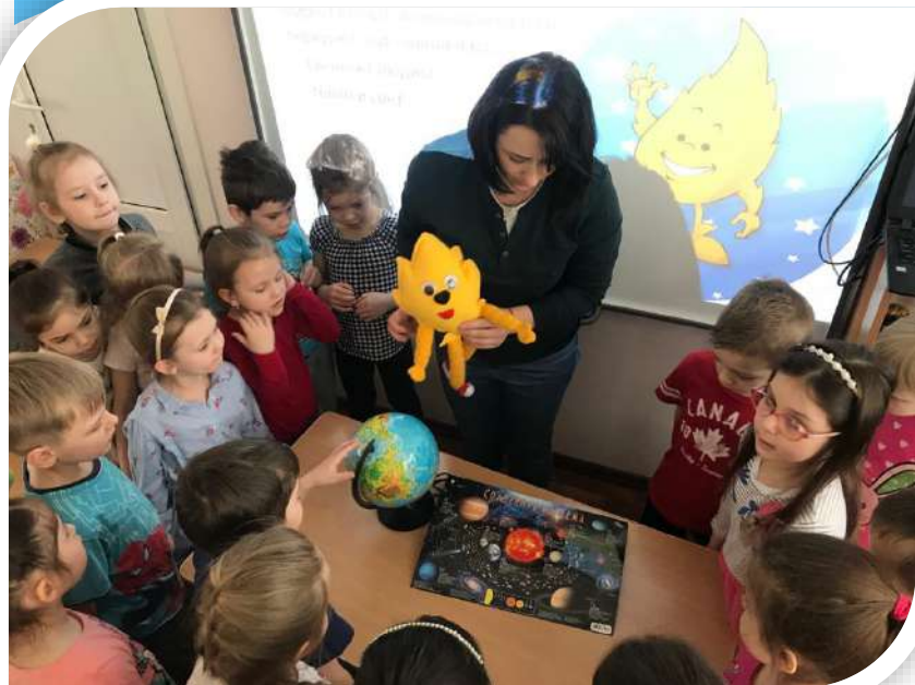
«Путешествие Афлотуна по планете Земля!»