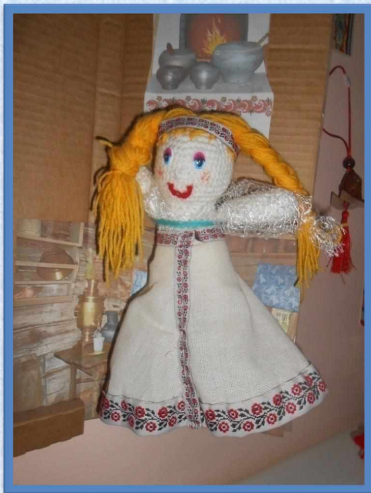
Кукла русская народная