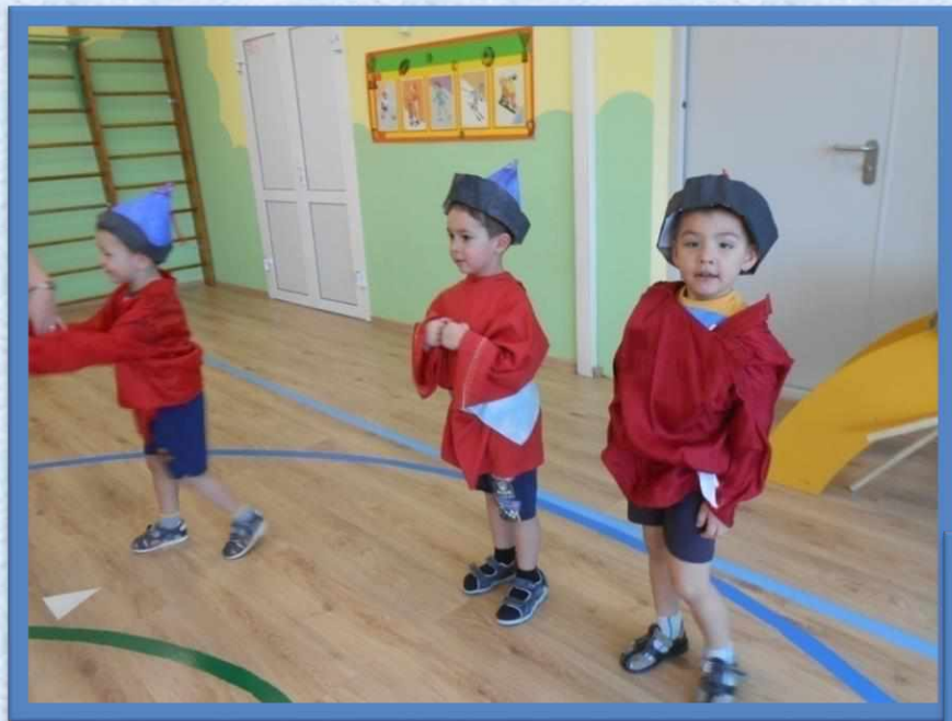
Национальные бурятские игры