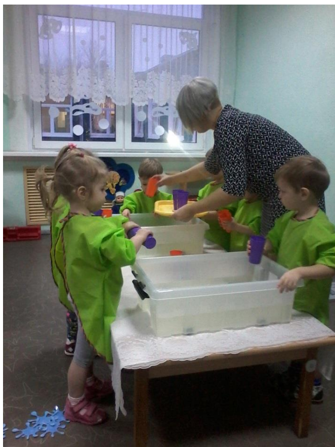
ГБДОУ детский сад №45 Красносельского района Санкт-Петербурга «Играем с водой»