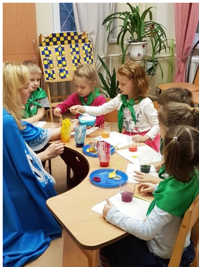
ГБДОУ детский сад № 72 Красносельского района Санкт-Петербурга Эколаборатория «Живая вода»