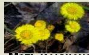
Мать и мачеха