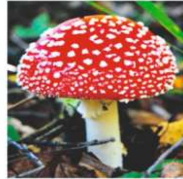
мухомор желчный гриб