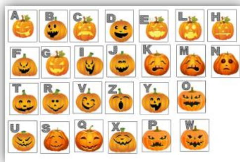
Рисунок 6. Тыквенный ключ для расшифровки Хэллоуинского послания

После этого присваиваются баллы за выполнение задания, оценка жюри носит дискуссионный характер, хоть они и представляют мнение своей группы, обосновывают поставленные баллы, какие ошибки слышали, что понравилось, тем не менее игровой балл присуждается, если цель достигнута и рассказ всё-таки написан, пусть и с ошибками, за скорость, как и писалось выше присваиваются дополнительные баллы, но только если задание было выполнено