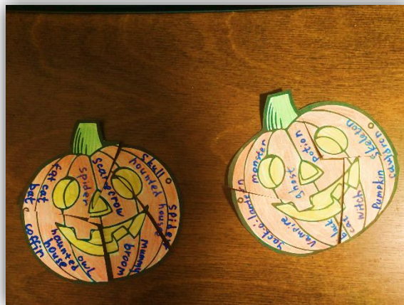
Рисунок 5. Лексический “Пазл-тыква”

По типу, задания, у обеих команд одинаковые, по наполнению могут варьироваться, так в одном из заданий квеста “Тыква-пазл”, слова, написанные