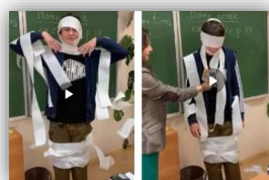
Рисунок 2. Финал квеста

Данный квест базируется на стратегии сотрудничества, но также имеет соревновательный элемент в своей основе.