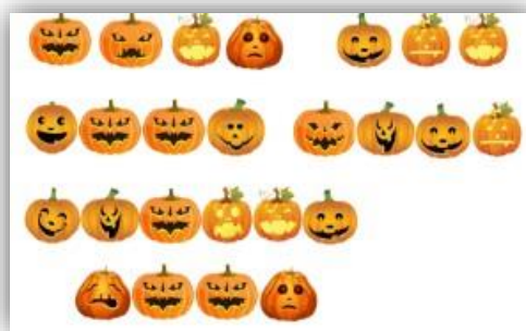
Рисунок 7. Хэллоуинское послание - Open the door with violet moon

Исходя из всего вышесказанного, очевидно, что применение квест-технологии на уроке английского языка идеально соответствует концепции ФГОС ООО о системно-деятельностном подходе в обучении школьников. Кроме того, здесь же стоит отметить реализацию таких важных требований к метапредметным результатам обучения как: освоение обучающимися универсальных учебных познавательных действий (дети успешно работают с информацией, осваивают базовые логические и исследовательские