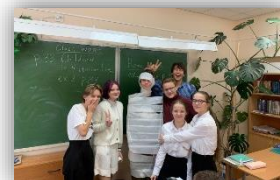
Рисунок 1 Мумия возвращается

Этот урок был апробирован в параллели всех 8 классов, 8а, 8б, 8в, ход проведения урока описан ниже. Ребятам удалось уложиться в 45 минут урочного времени пройти все этапы квеста, добраться до финала, где мумия возвращается, а затем восстаёт, ребята уходили с горящими глазами и желанием изучать английский язык, благодарили за отличный урок и дружескую атмосферу на уроке, решили сделать коллективное фото на память.