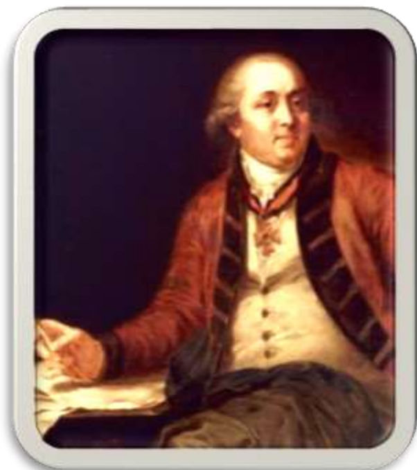
Архитектор Иван Егорович Старов

Дворец «Пелла», построенный Старовым, не уступал Таврическому в смысле архитектурного великолепия.