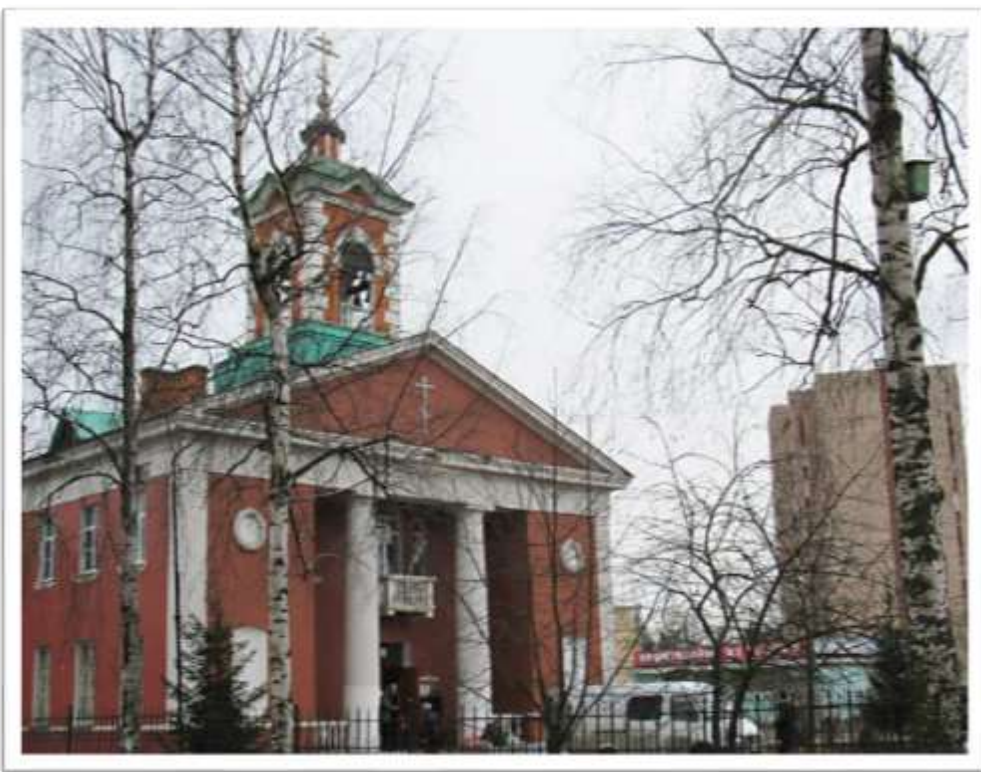
Современная церковь в Ивановской

У Невских порогов осталась мыза Пелла и почтовая станция, напоминавшие об екатерининских временах, осталась и деревня Ивановская в версте от неё, приписанная к придворному ведомству. В 1810 -1819 годах здесь были построены деревянные воинские казармы (инженер Г.И.Третер. Позже их перестроили для размещения не только лейб-гвардии Конной артиллерии, но и образцовых казачьих частей.