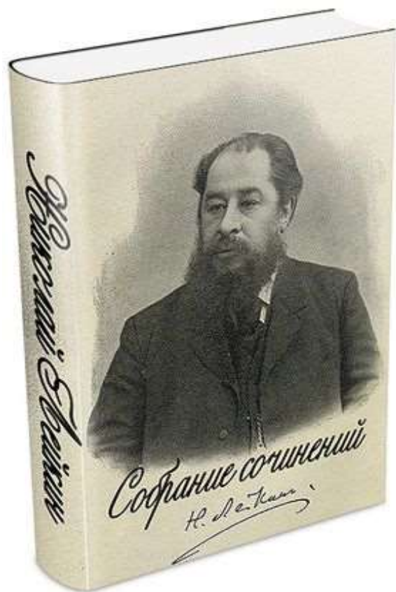
Николай Александрович Лейкин

Н.А. Лейкин - член С-Петербургской городской комиссии благотворительности - открыл в Ивановском Дом Трудолюбия, где мастера обучали желающих разным ремёслам, за что был награждён орденом св. Анны 3 степени. «Мы благодарим судьбу, - писал он, - что у нас есть такой прелестный уголок, как дача в Ивановском. Всё мне здесь по нутру».