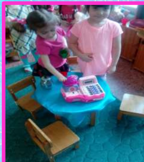
Игры творческие, сюжетно-ролевые.