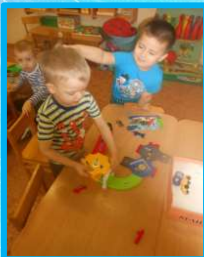
Строительные, трудовые, технические, конструкторские.