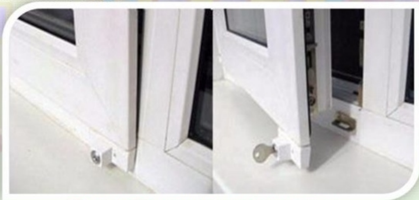
Замок блокировщик с ключом

Можно воспользоваться специальными замками блокираторами, которые предлагают установщики пластиковых окон.