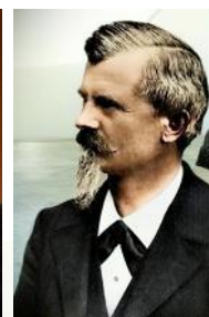
Готтлиб Даймлер Вильгельм Майбах