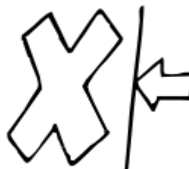
4. Нарушение запрета