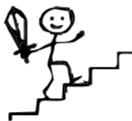
7. Способ достижения цели