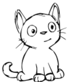
6. Появление друга - помощника