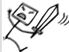
8. Враг начинает действовать