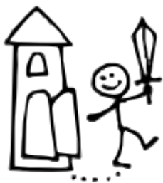
5. Герой покидает дом