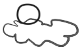
2. Особое обстоятельство

28. Мораль (какой вывод можно сделать из случившейся истории).