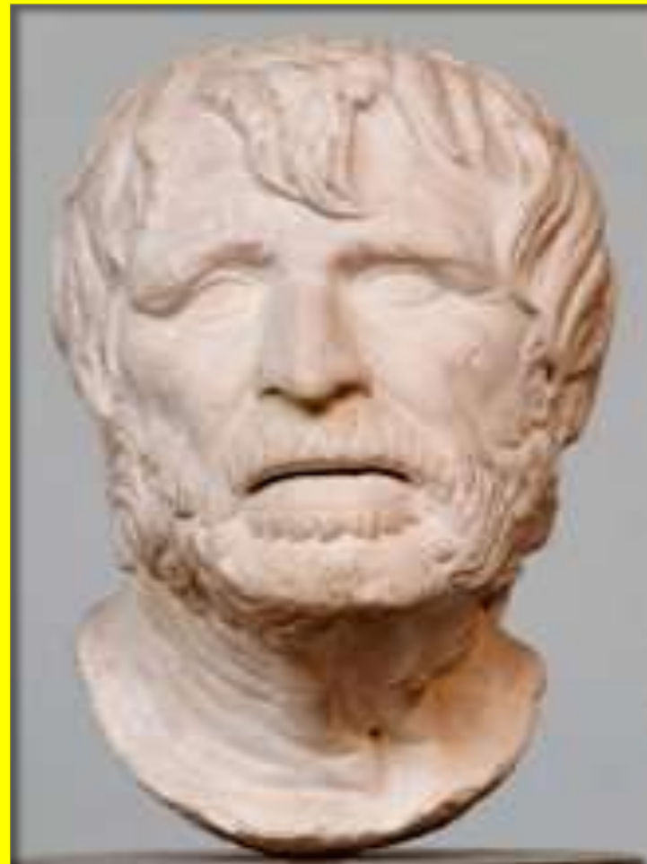
Гесиод ок. 720 г. до н. э

Я утратил всякие надежды относительно будущего нашей страны, если сегодняшняя молодежь завтра возьмет в свои руки бразды правления, ибо эта молодежь невыносима, невыдержанна, просто ужасна.