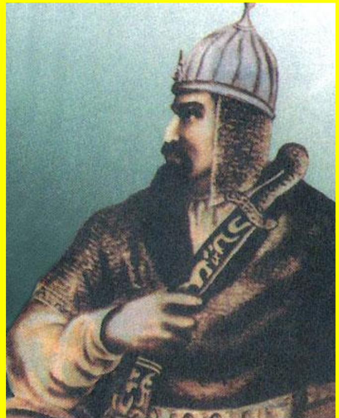
Кенесары хан (1802 - 1847) қазақ ханы, ұлт-азаттық көтеріліс көсемі

1841 г. – представители трех жузов избрали Кенесары своим ханом. 1844 г. – Кенесары признан в качестве хана всеми правителями государств Средней Азии. 1847 г. Кенесары казнен киргизами с которыми воевал. Голова султана передана в Омск генерал-губернатору Западной Сибири.