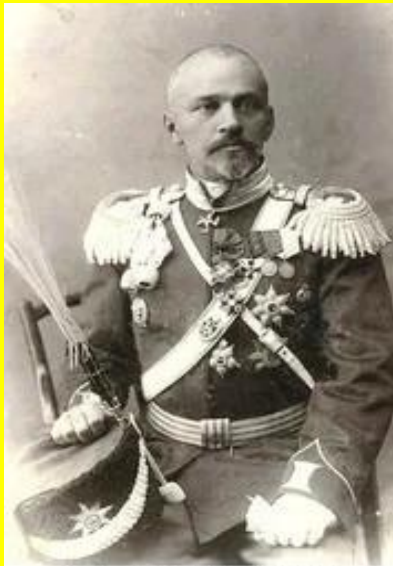
Военный губернатор Семиреченской области генерал-лейтенант М.А. Фольбаум

Михаил Александрович Фольбаум (Соколов- Соколинский) (1866 — 1916) Бакинский градоначальник (1908) военный губернатор Семиреченской области (1908—1916).