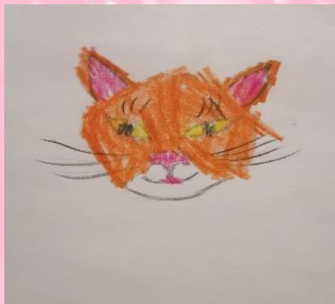
Герб семьи Кузнецова