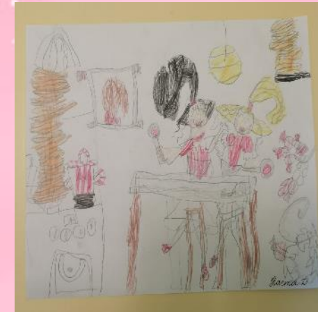
Вместе в мамой