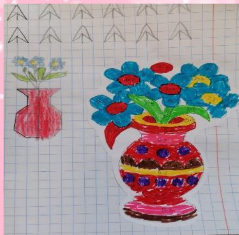
Математика «Сюрприз для мамы»