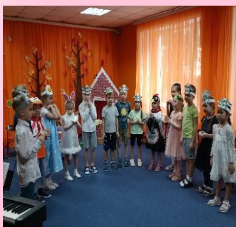
Театральная постановка «Семеро козлят»