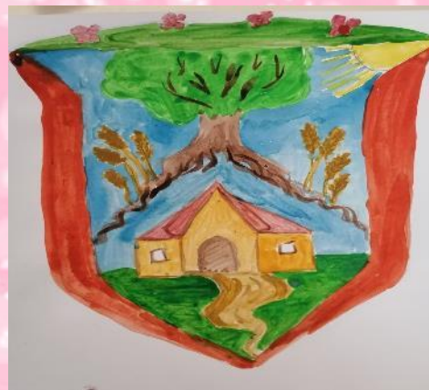
Герб семьи Дробышевых