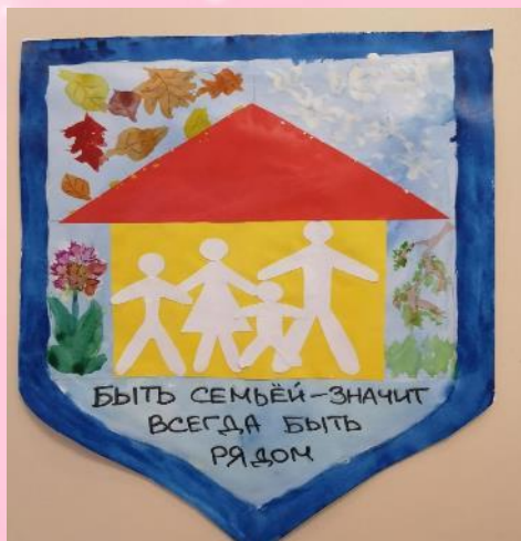
Герб семьи Карчевских