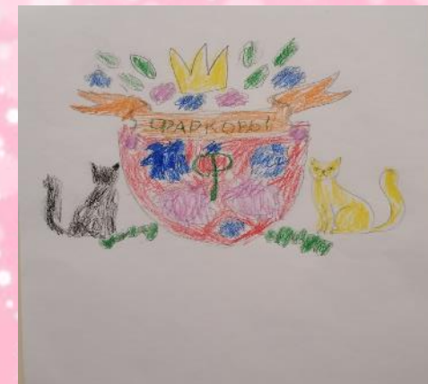
Герб семьи Фарковых