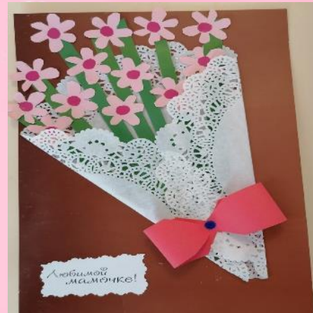
Открытка для мамы