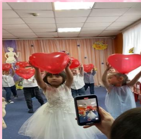
Развлечение «Моя милая мама»