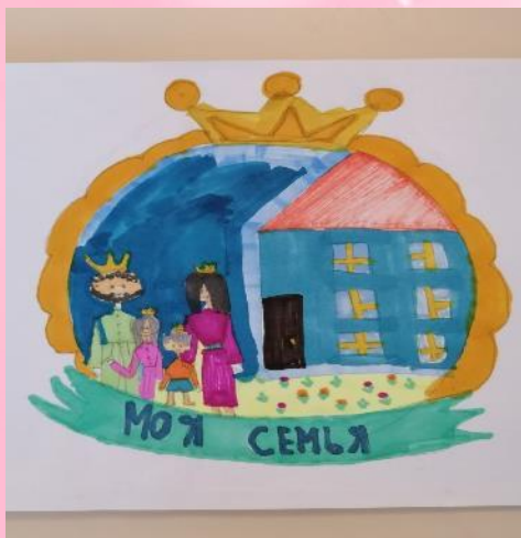
Герб семьи Амент