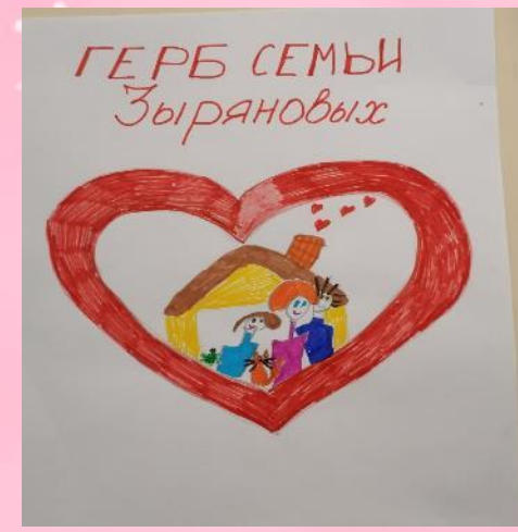
Герб семьи Зыряновых