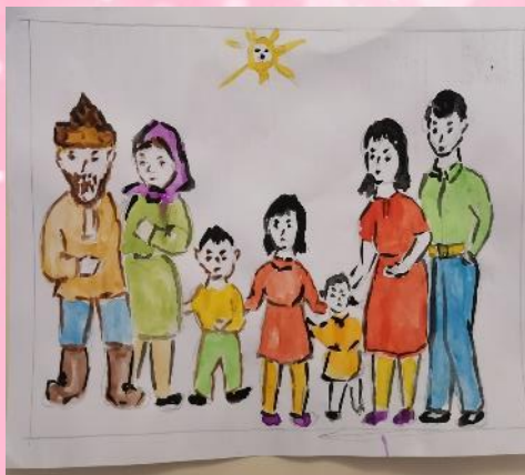
Герб семьи Собириных