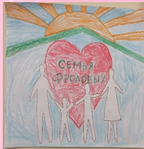
Герб семьи Фроловых