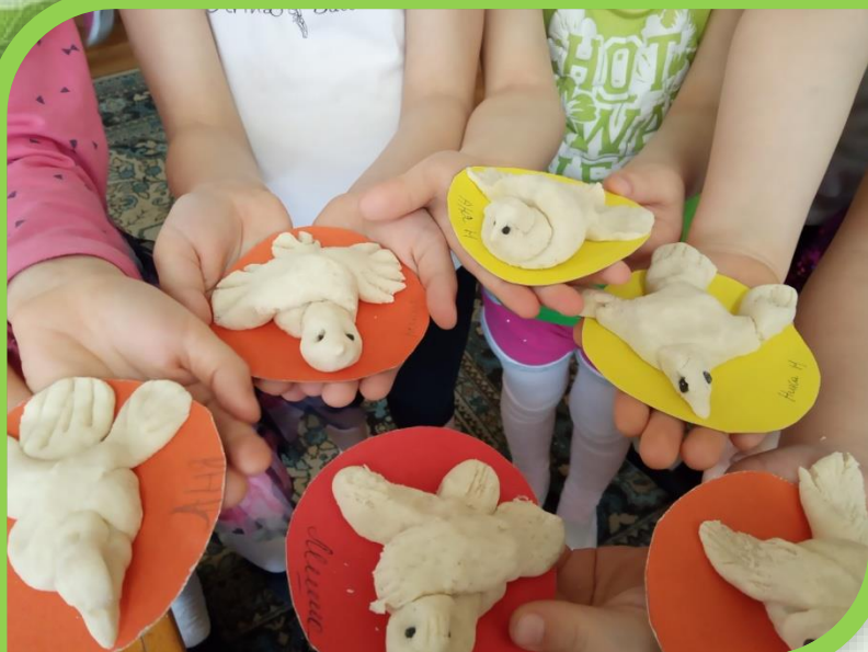
Лепка из соленого теста «Скворушка»