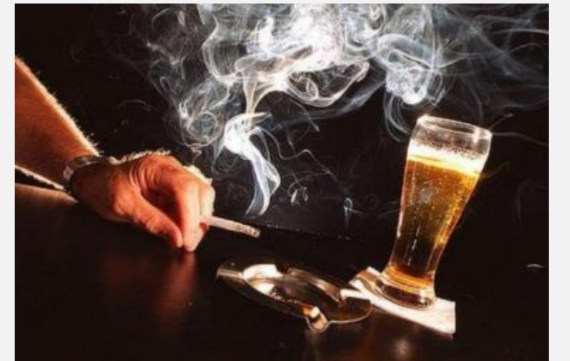
АЛКОГОЛЬ И КУРЕНИЕ