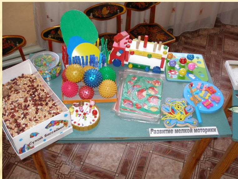
Развитие мелкой моторики