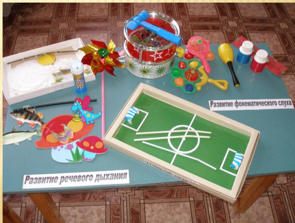
Развитие фонематического слуха