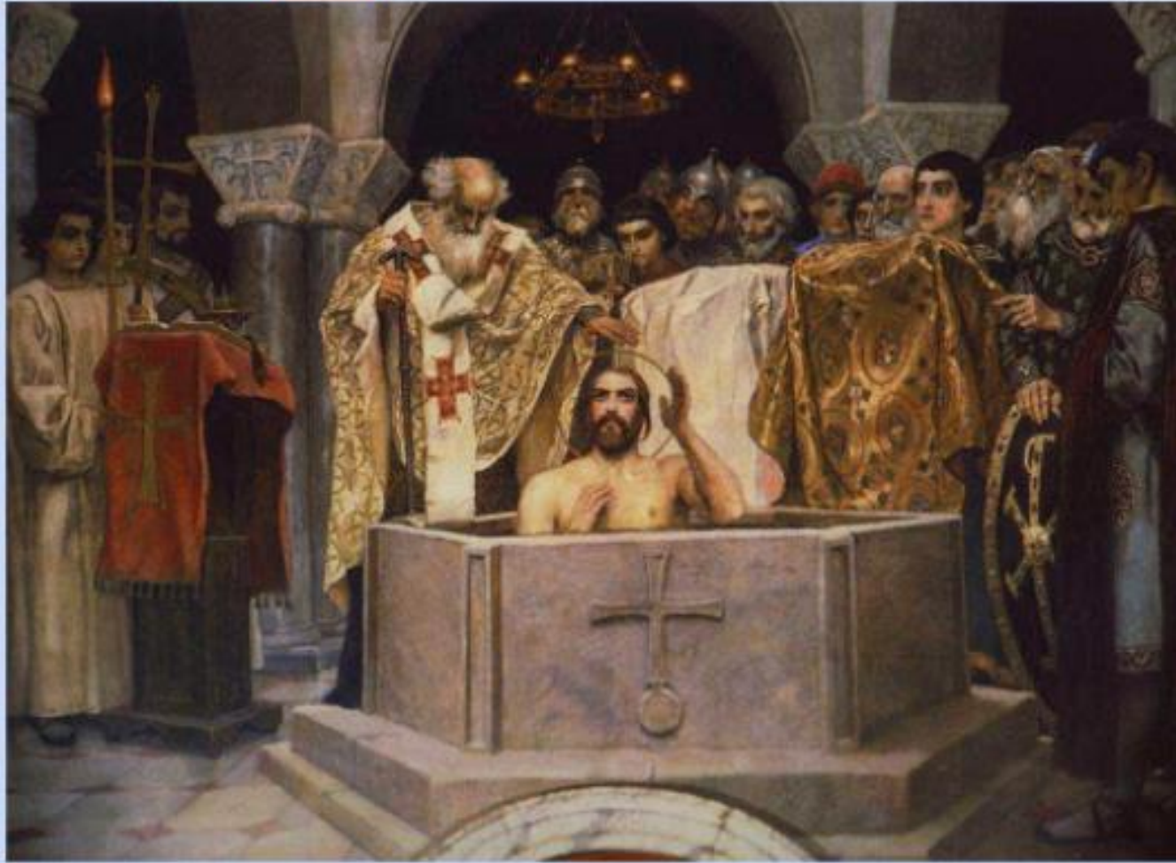
Крещение князя Владимира. Фреска В.М. Васнецова