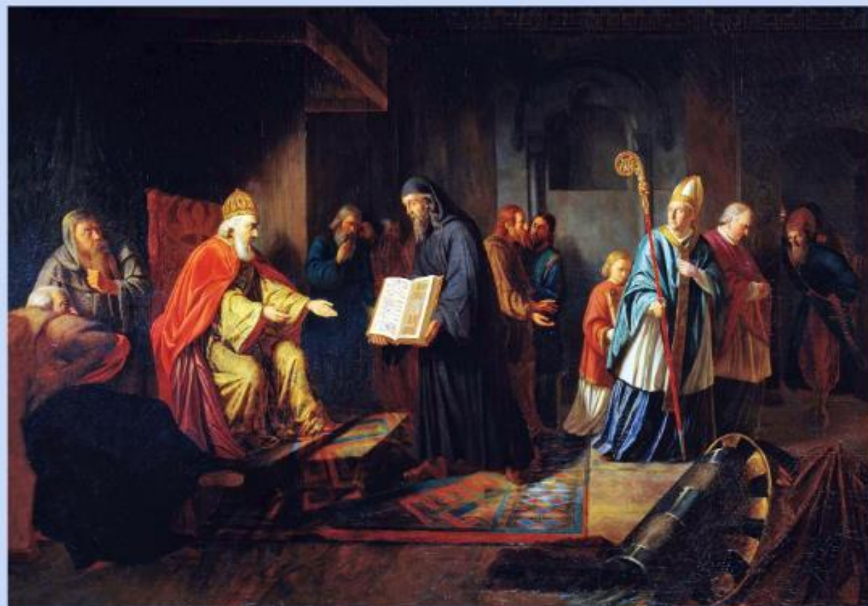
Князь Владимир избирает религию

Пришел и греческий проповедник из православной Византии . Он рассказал князю содержание Ветхого и Нового Заветов и показал изображение Страшного Суда. Отпустил князь Владимир проповедника с дарами и великою честью, а сам решил собрать бояр и спросить совета. Бояре и старцы предложили направить послов в разные земли чтобы испытать, который народ достойнее поклоняется Божеству.