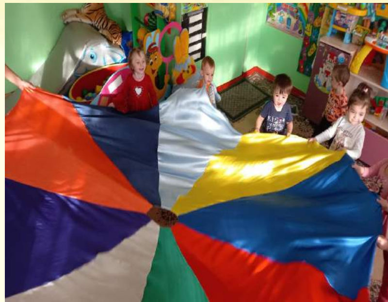
Игра «Круги дружбы»