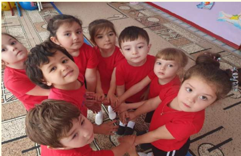
Игра «Здравствуй друг!»