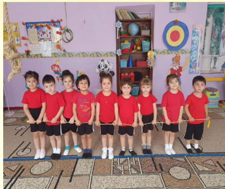
Игра «Два берега»